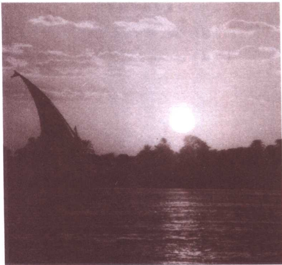
孕育了人类与文明的尼罗河

但很奇怪，这些与世隔绝的小矮人们，却知道现代世界最流行的一样东西，那就是——“权利”。