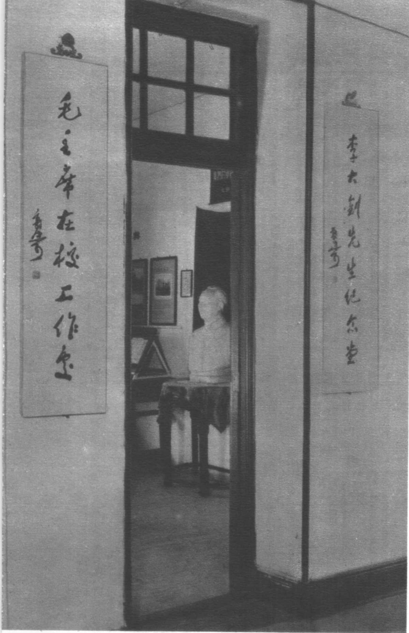
十月革命后，毛泽东同志和李大钊同志在 北京大学红楼研究和传播马克思列宁主义