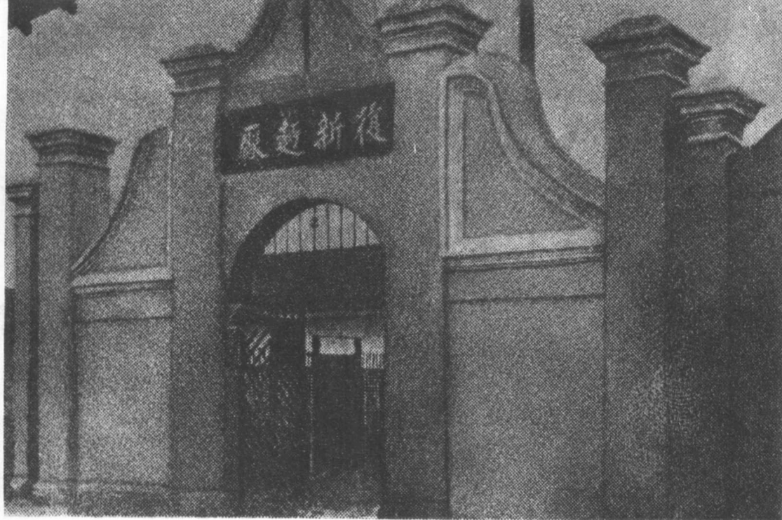
1909年建立的南通復新面粉廠