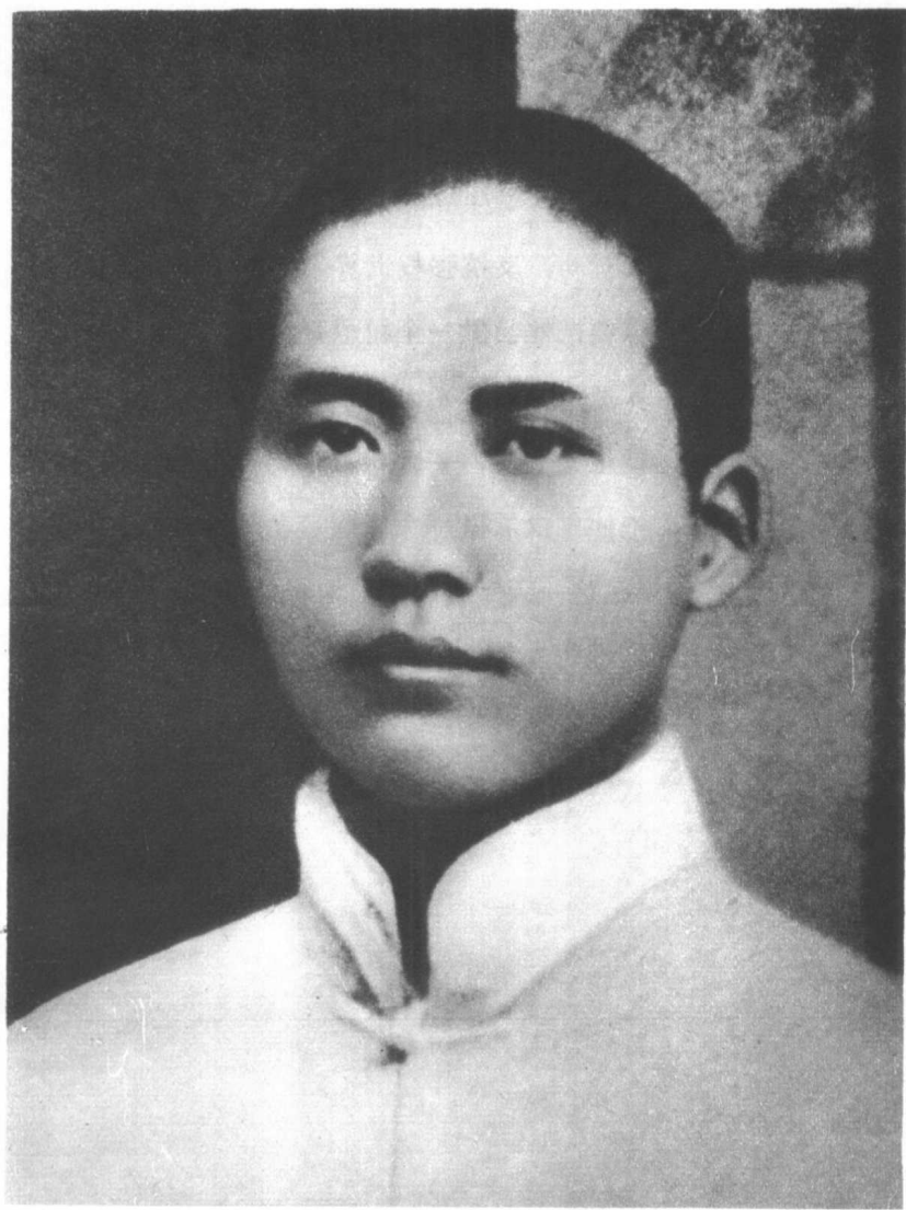
五四时期的毛泽东同志