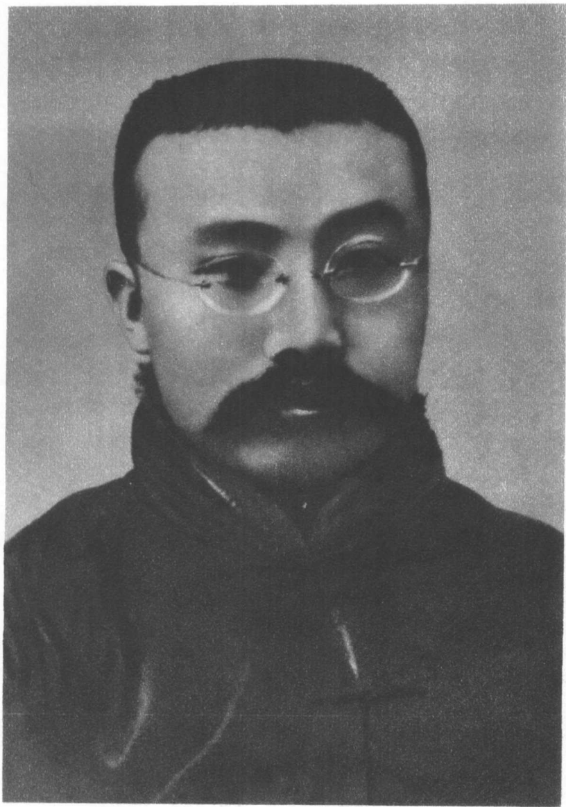
五四时期的李大钊同志