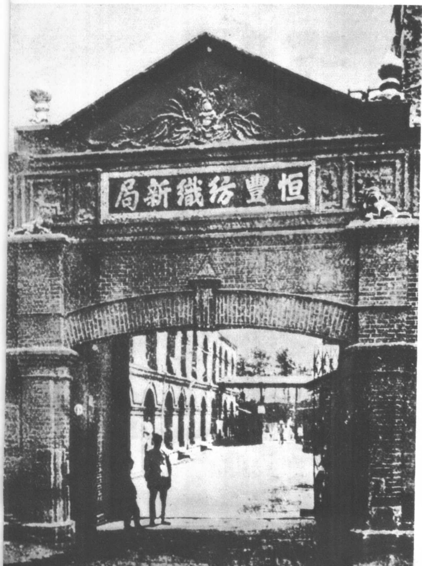
1917年的上海 恒丰纺织新局

在第一次帝国主义世界大战之后，由于大战期间欧洲帝国主义放松了对中国的经济侵略，中国资本主义就有了进一步的发展，中国工人阶级的人数就此激增，中国工人阶级的力量也更加壮大起来，这是五四运动产生的深刻的社会基础。