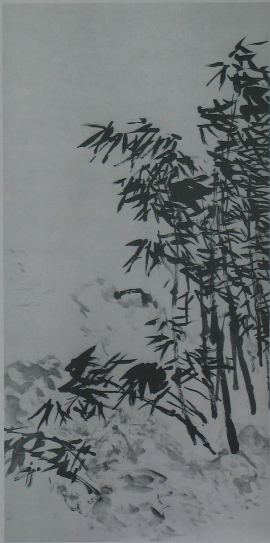
墨竹（四条屏）王个簪