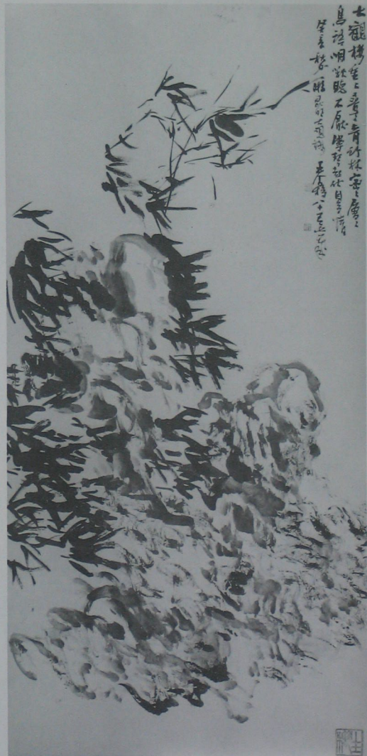
墨竹（四条屏）王个簃