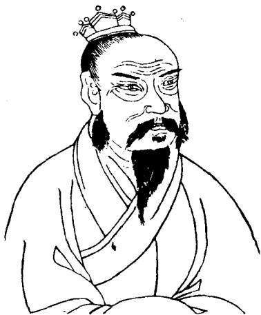
開創漢朝的高祖（劉邦）