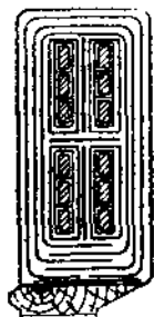
圖 38-3. 半閉槽