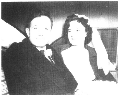
纳什和艾利西亚在婚礼之后。1957年2月，首都华盛顿。