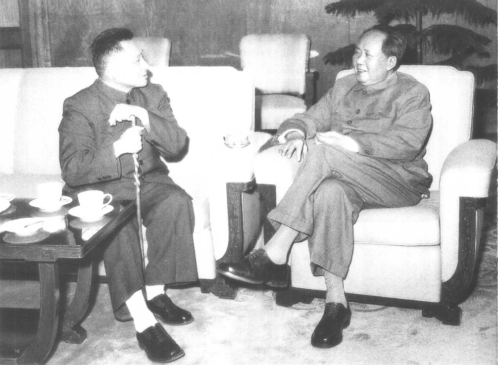
◎1960年和邓小平在北京