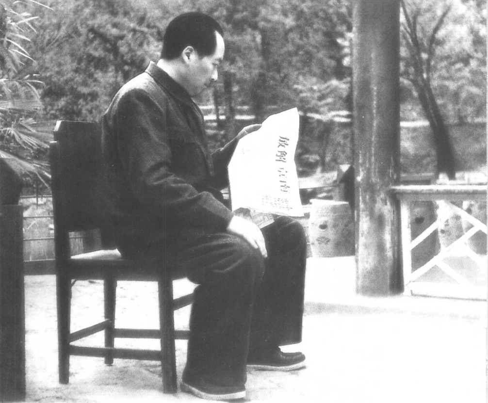
◎1949年4月在北平香山双清别墅看解放南京的捷报