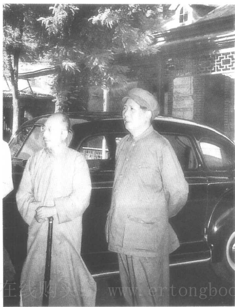
◎1949年8月和 柳亚子先生在一 起