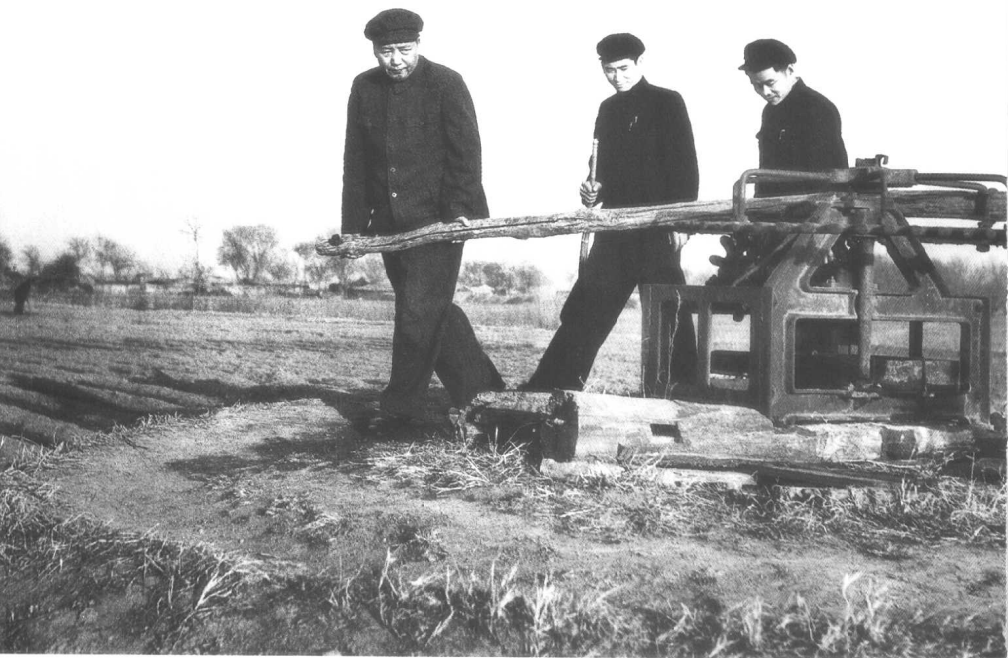
◎1954 年在北京顺义县农村