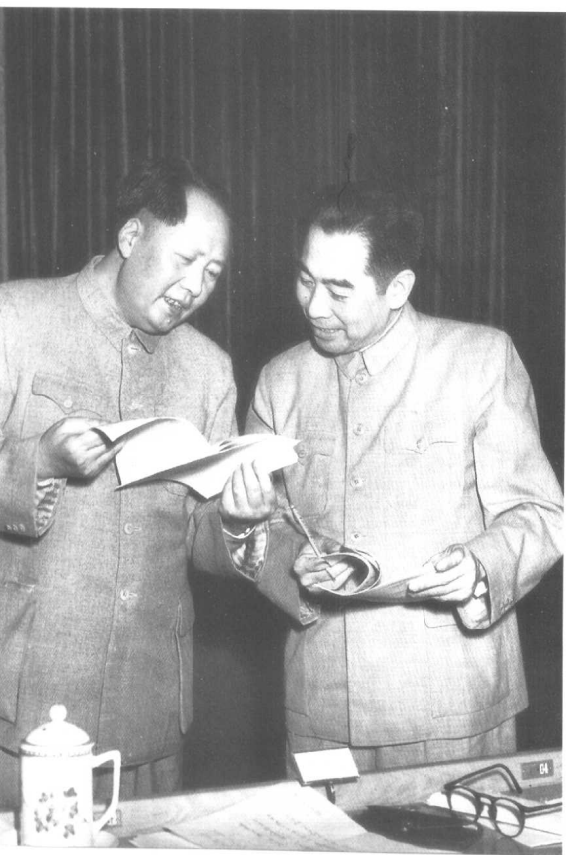
◎ 1953 年和周恩来 在中央人民政府 委员会会议上