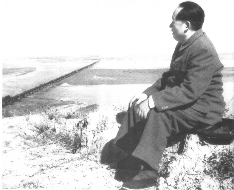
◎ 1952 年视察 黄河