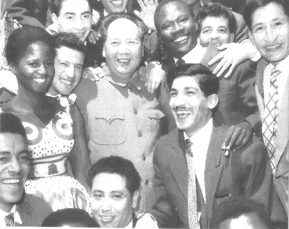
◎1959 年和亚非拉青年朋友在一起