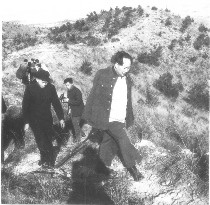
◎1954 年 2 月 10 日登杭州 西子湖畔的北 高峰