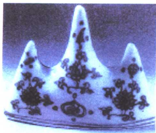
正德年间青花笔架山（瓷器）