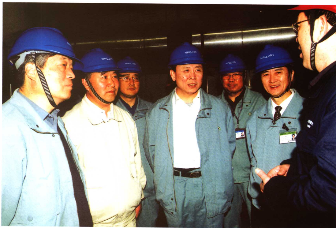
国防科工委、中核集团公司的领导在工程建设一线了解工程进展、生产运行情况