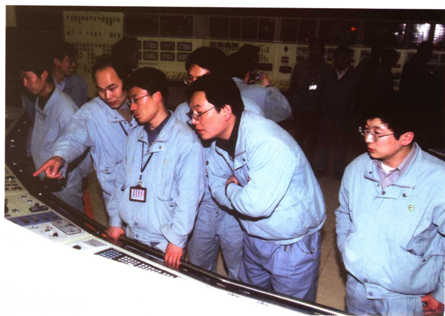
2号机组首次并网发电