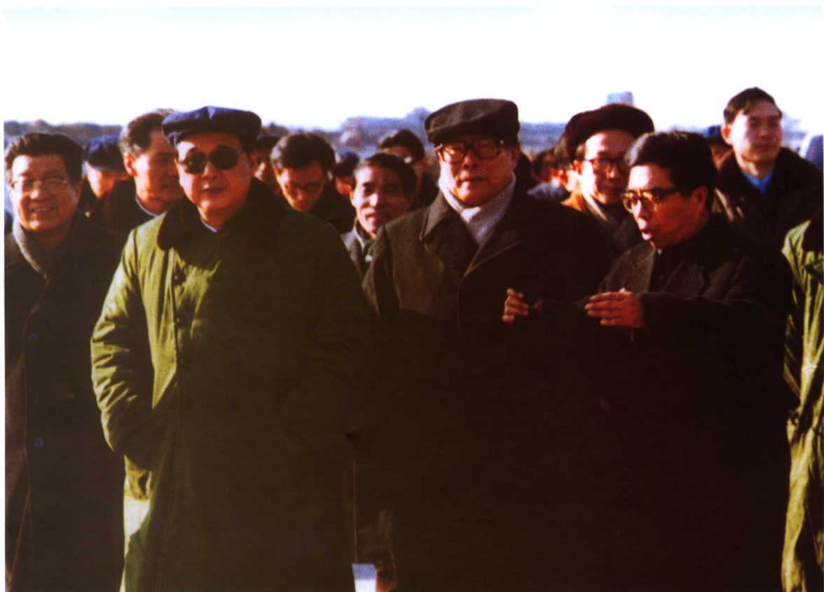
中央军委主席江泽民，李鹏视察秦山核电现场