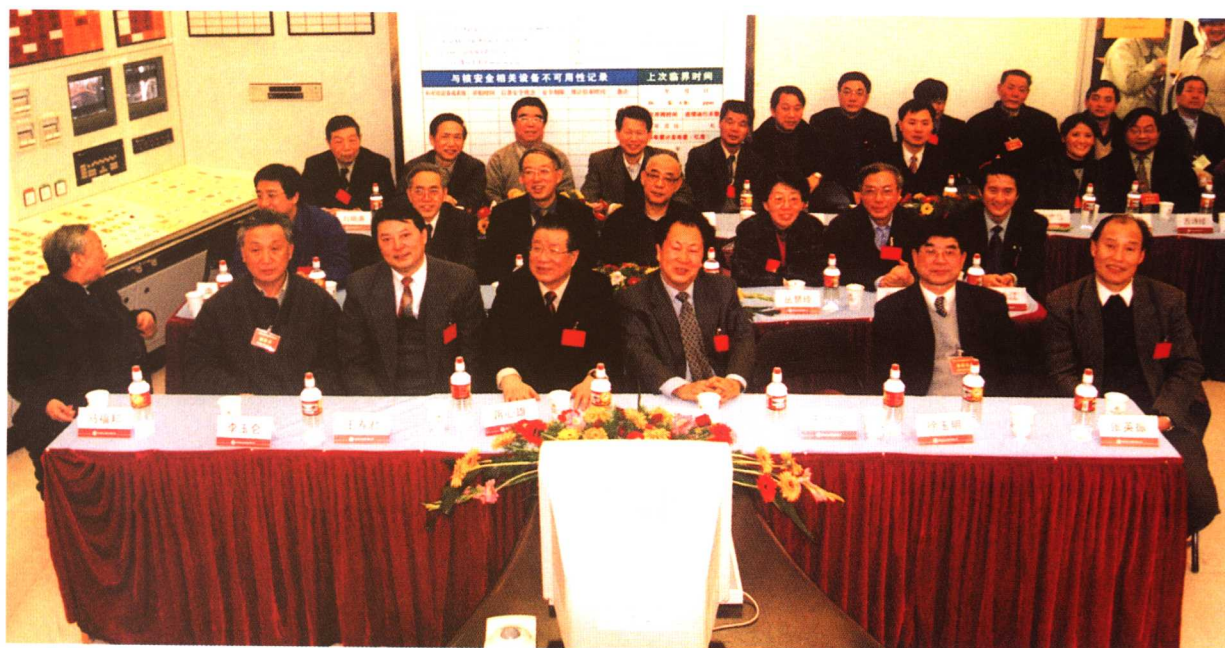
1号机组首次并网发电成功时主控制室在座的领导们