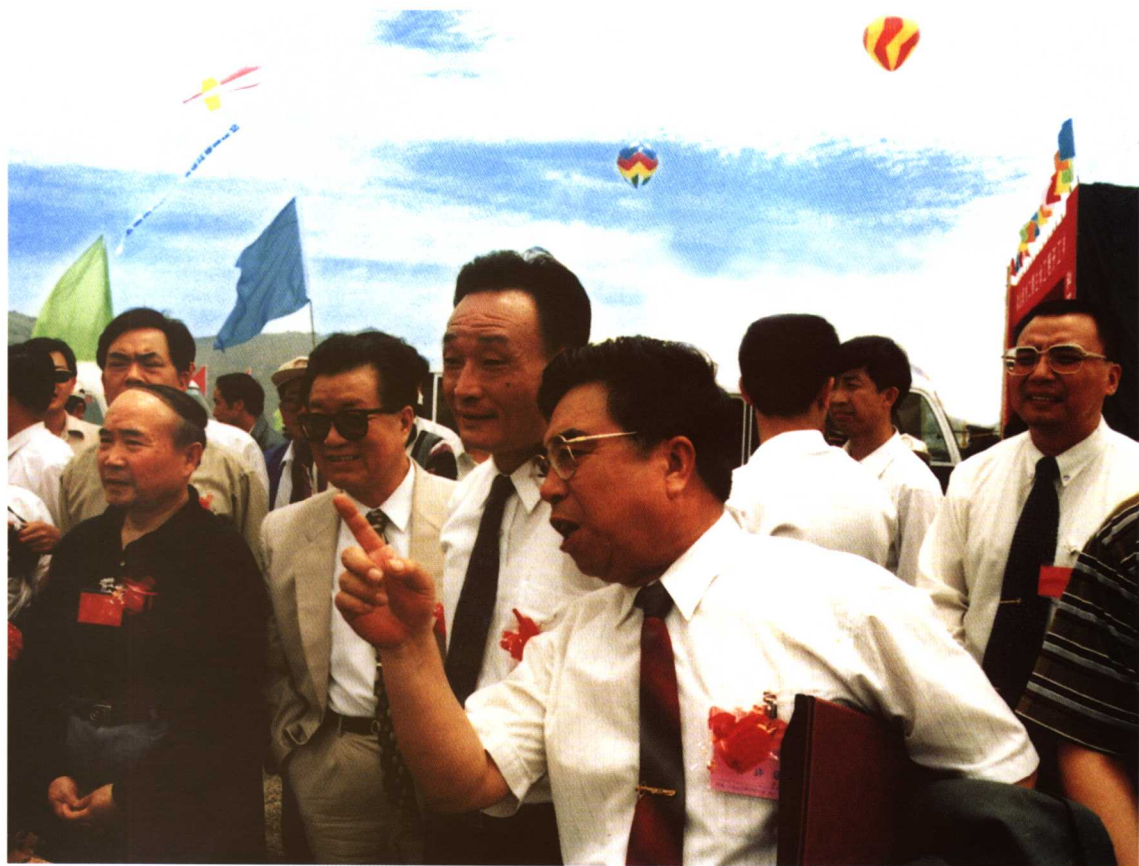
全国人大常委会委员长吴邦国在秦山第二核电厂施工现场视察