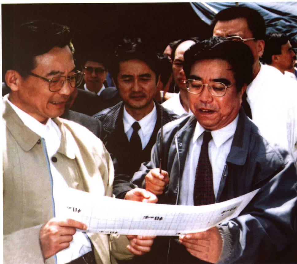
国务院总理温家宝在秦山第二核电厂施工现场视察