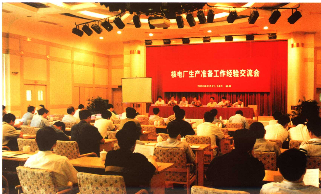
核电厂生产准备工作经验交流会在杭州举行