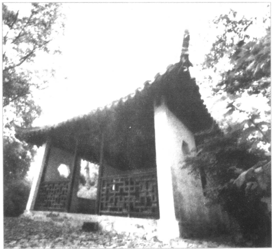
常熟昭明太子读书台