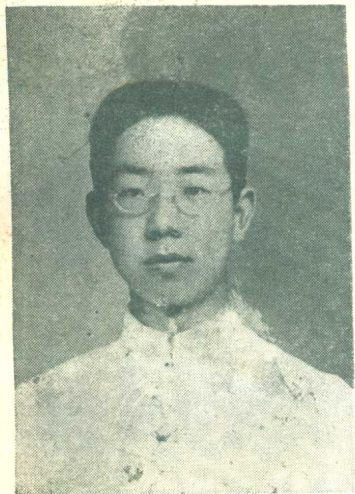
一九二〇年二十歲時攝 在北京開始文學生涯