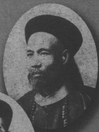
曾国藩子纪泽 出使英国时所摄