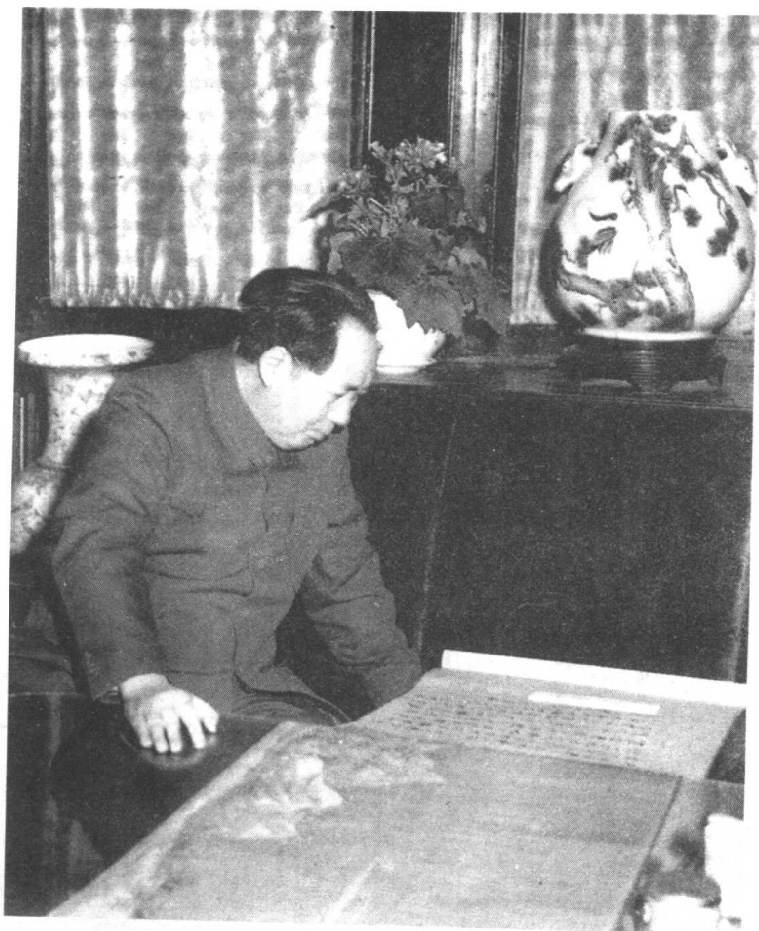
毛泽东在观赏中国古画(1953年)