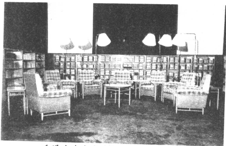
毛泽东在中南海的书房及会见厅