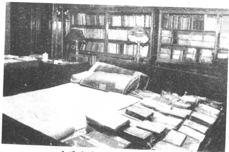
毛泽东在中南海的卧室