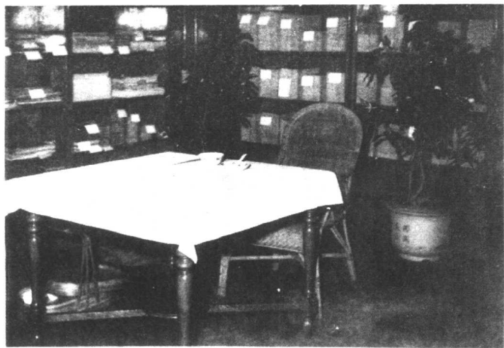
毛泽东在中南海的餐厅