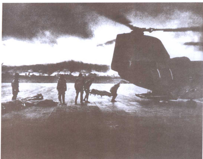
●1966年越南战场上，抬到直升机上的是一具具美国兵的尸体。