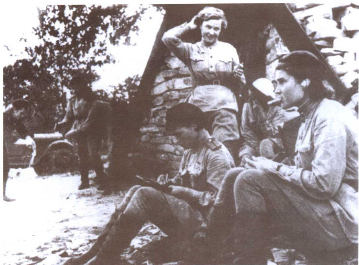
●在卫国战争艰苦的岁月里，有80万苏联妇女穿上了军装，为赶走法西斯侵略者而浴血奋战。