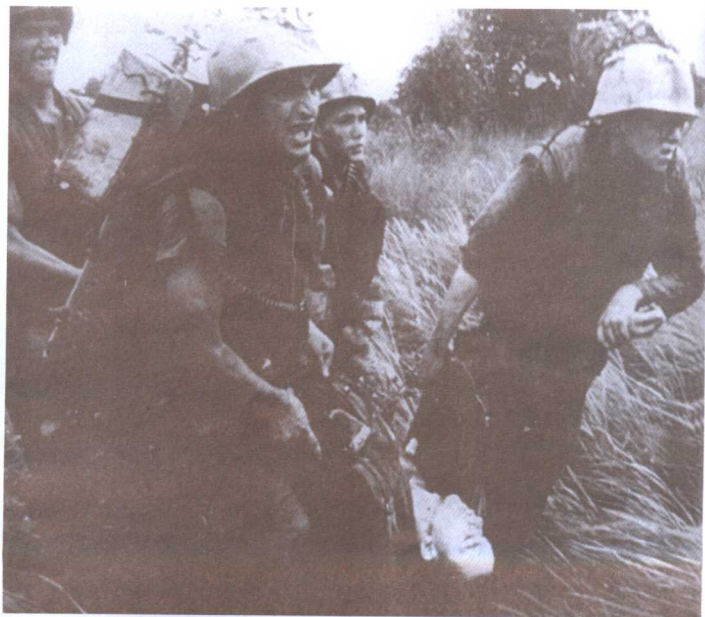
●1966年，在越南战场上，美军在丛林中遭伏击，狼狈逃窜。