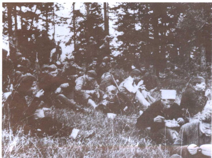
●聚餐之后，南斯拉夫游击队员们将去袭击驻守利蒂亚桥的德军。