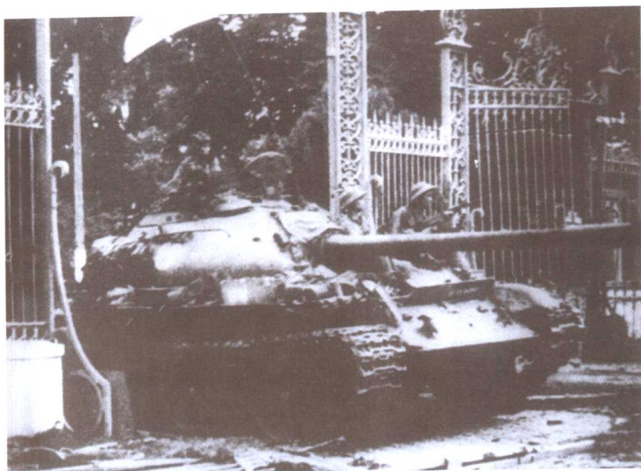
● 1975年4月30日，越南北方先头部队冲进南越总统府。