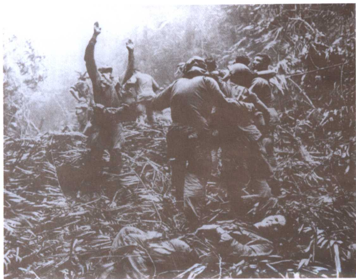
● 1968年，一小队侵越美军在南越丛林中遭袭击，迷失了方向，正等待救援。