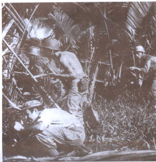
● 1942年，美军在新几内亚热带丛林中搜索前进。