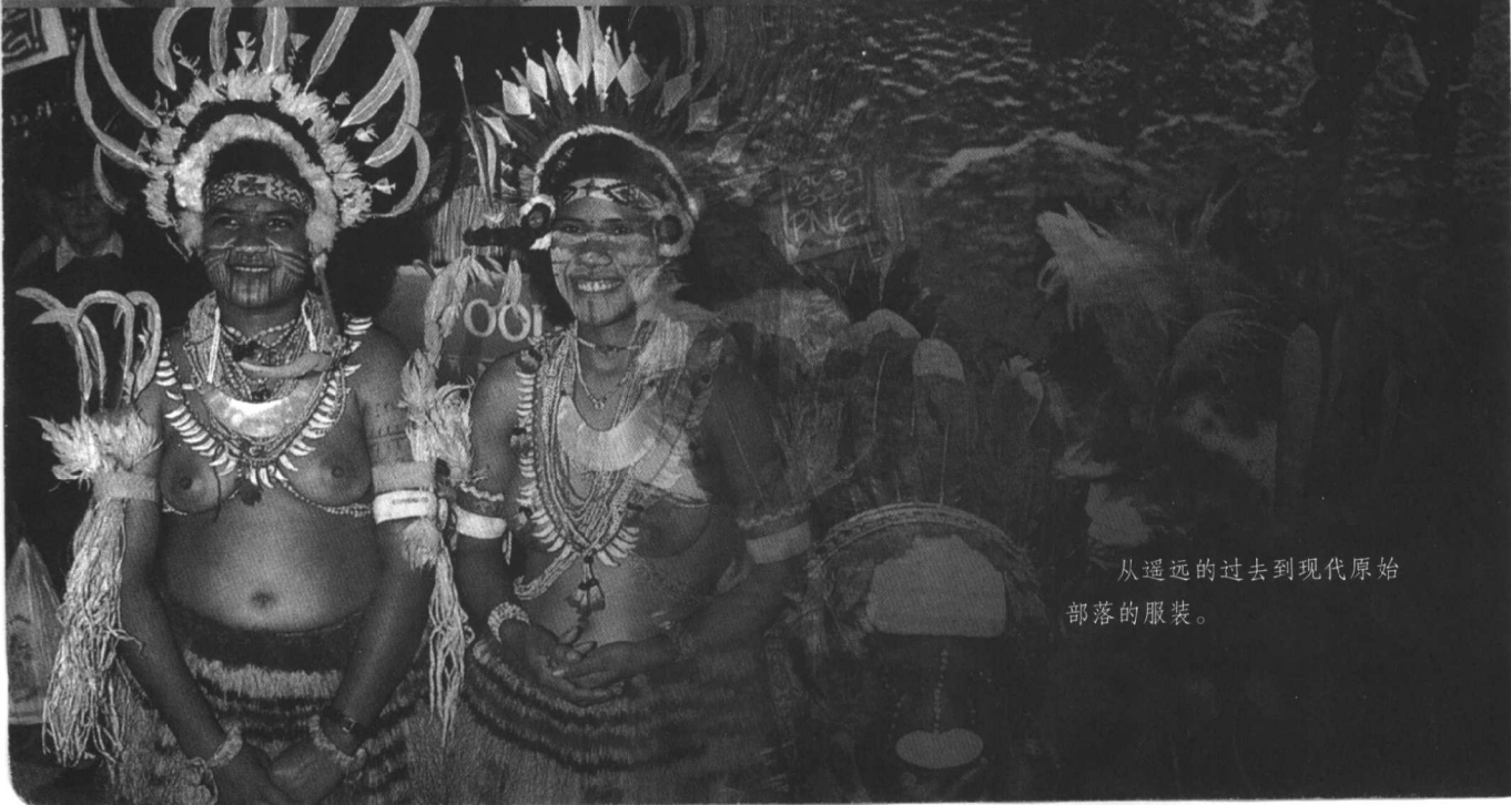
从遥远的过去到现代原始部落的服装。