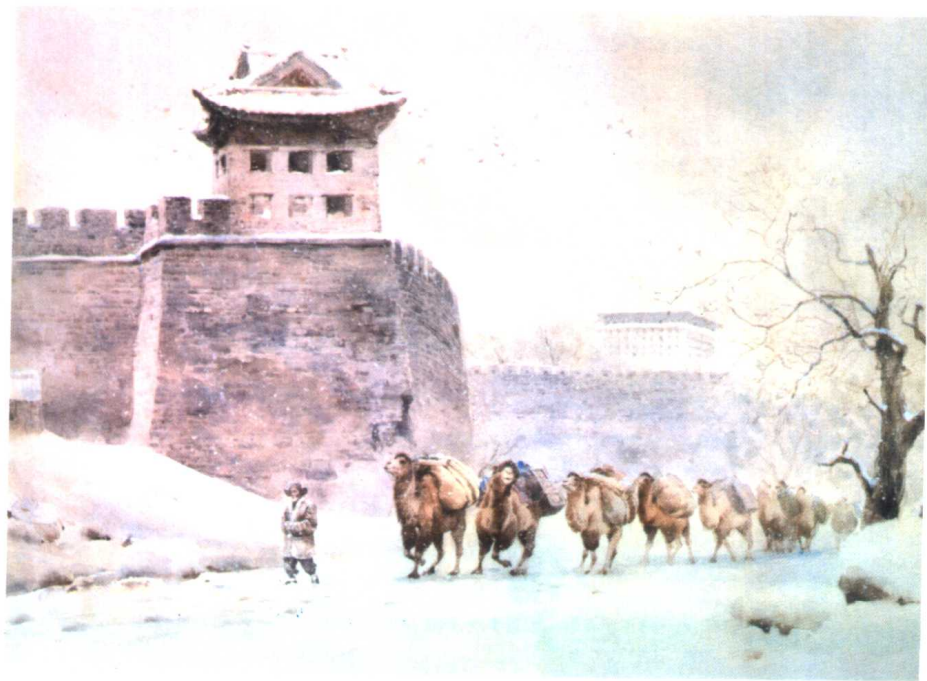
关维兴为《城南旧事》所作插图