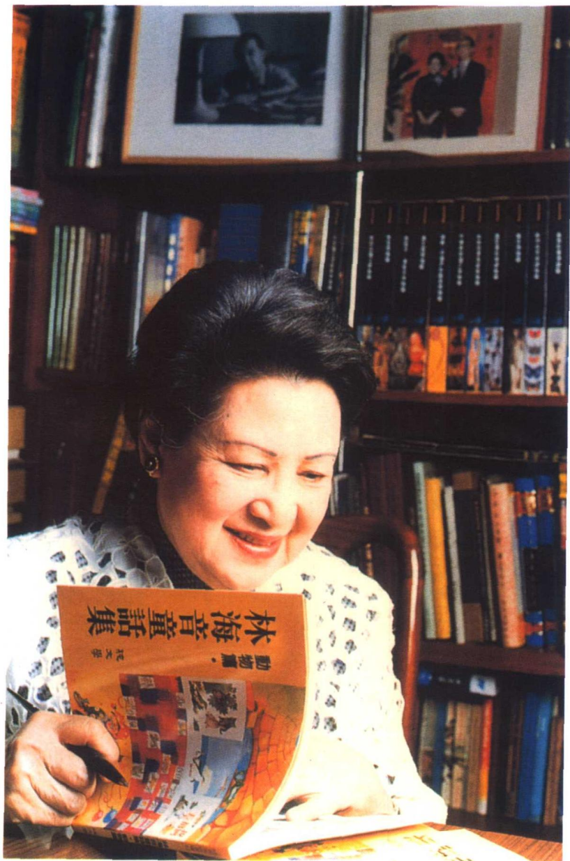
充满爱心的林海音创作过不少童话故事