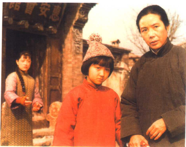
电影《城南旧事》剧照(1982年)