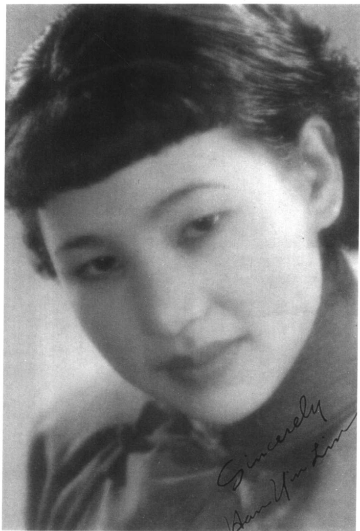
就读北平新闻专科学校时的林海音，出落得成熟大方