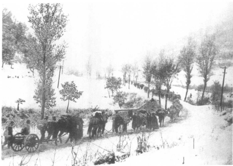
志愿军炮兵第1、第2师冒雪向前线开进