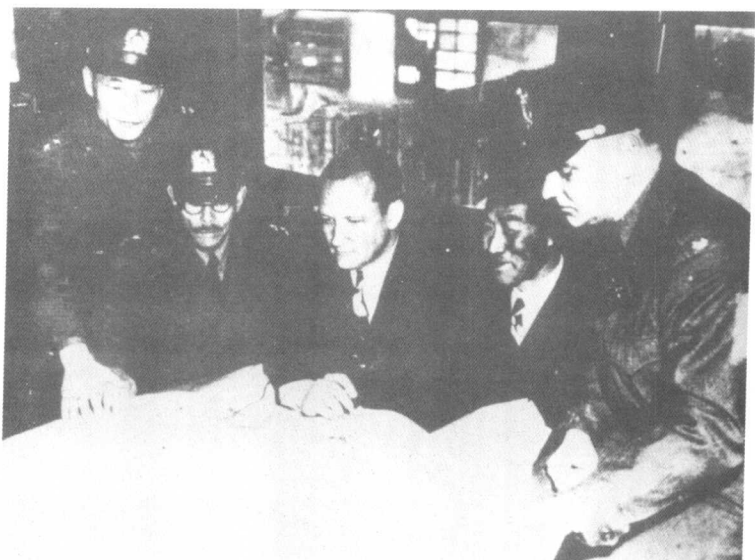
美国策划发动侵朝战争