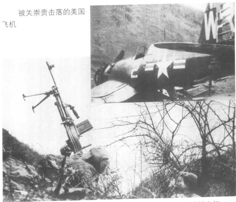
二级英雄关崇贵用轻机枪打退敌人多次进攻，并击落敌机1架