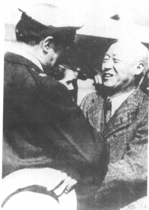
麦克阿瑟被任命为侵朝「联合国军」总司令。图为麦克阿瑟与南朝鲜总统李承晚（右）在一起。