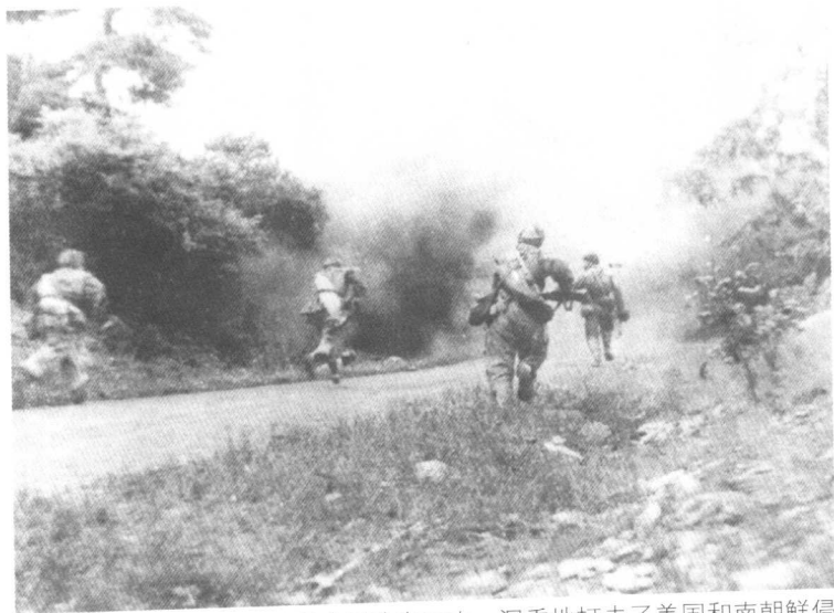
志愿军于1950年11月2日攻克云山，沉重地打击了美国和南朝鲜侵略军。图为志愿军某部四连战士向敌阵地冲锋