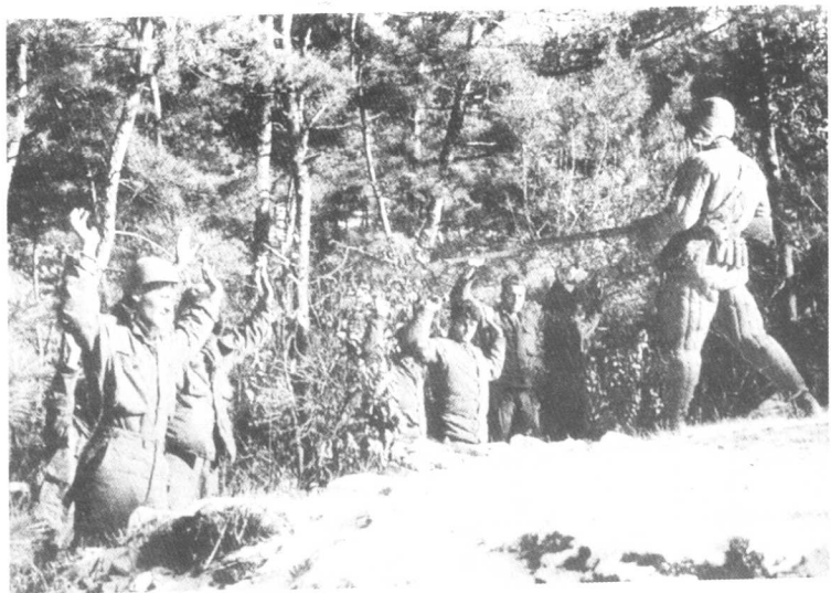
志愿军战士在军隅里山林中搜索残敌