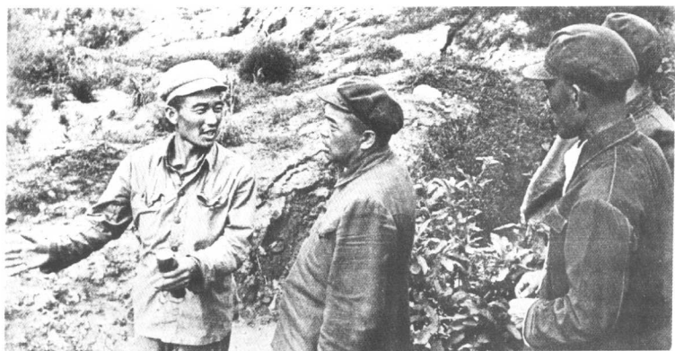
志愿军某营参谋长向彭德怀司令员介绍阵地情况