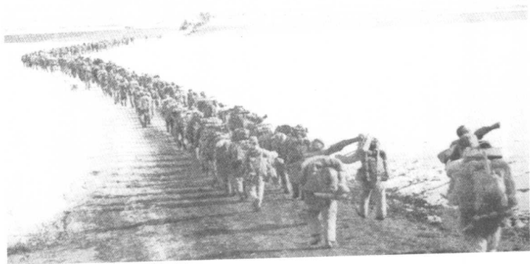
中国人民志愿军入朝参战