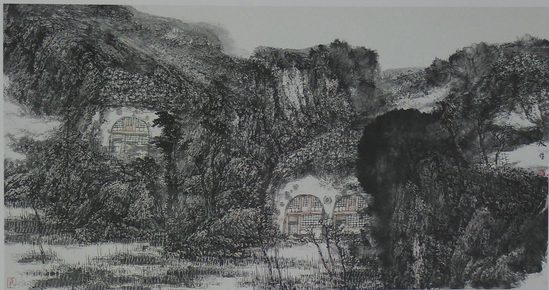
陕北系列之三 90cm x 192cm 2000