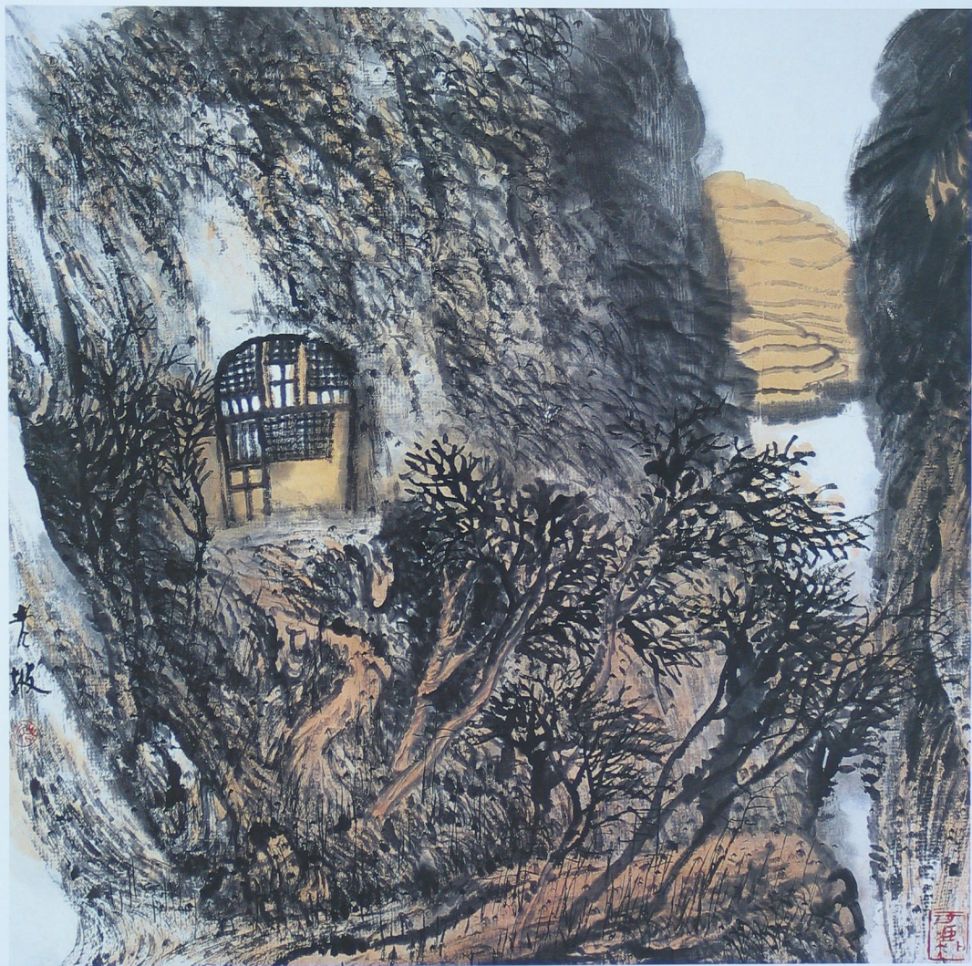
陕北系列之一 68cm x 68cm 1997年