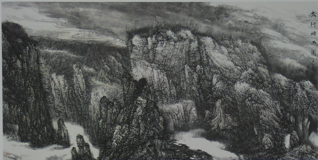
太行烟雨图 125cm × 246cm 2002