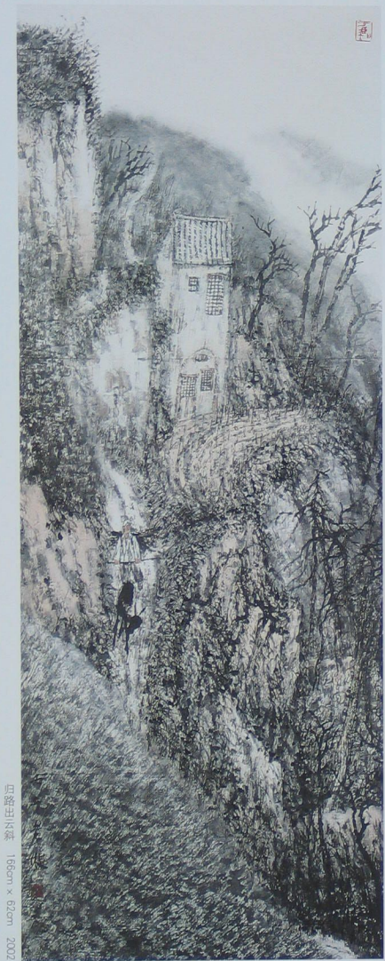
山居图(卷) 168cm x 62cm 2002