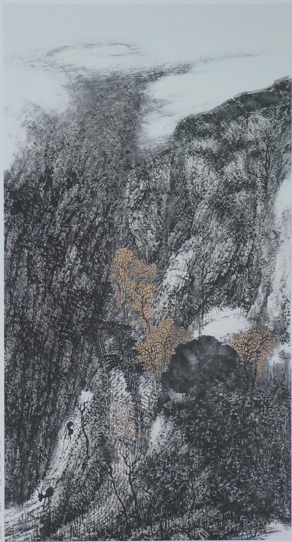
山居图(卷) 97cm x 180cm 2002