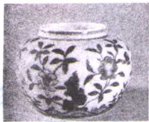
明 成化斗彩花卉纹罐