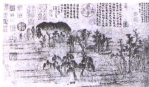
赵子昂 鹤华秋色图