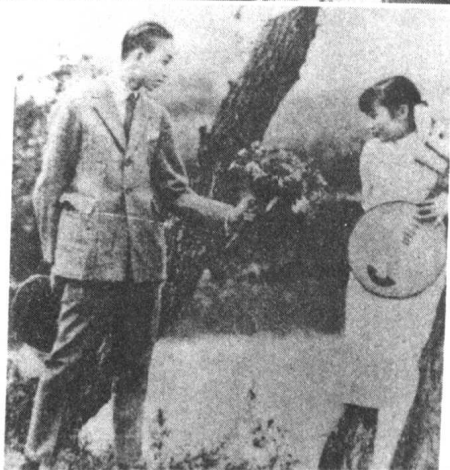
◎这些是胡蝶的银幕形象。这位30年代的影后,17岁开始演戏,直到59岁定居加拿大息影,主演过60多部电影。从上至下分别为:《碎琴楼》、《桃花湖》、《大侠白毛腿》。