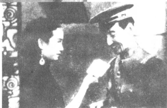
◎这是胡蝶在《自由之花》、《女儿经》、《再生花》中的剧照。