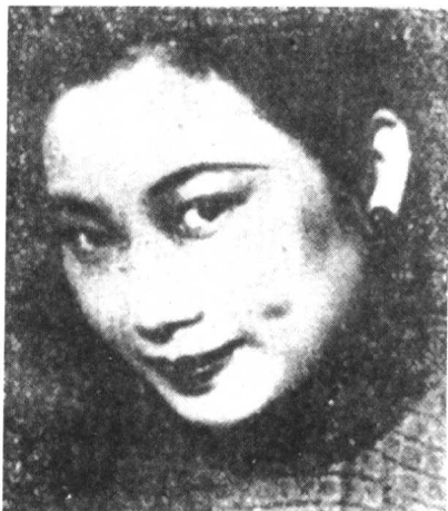
◎胡蝶于1928年进入明星影片公司，成为明星最具艺术号召力的演员之一。抗战爆发，明星公司被炮火焚毁，胡蝶来到香港。