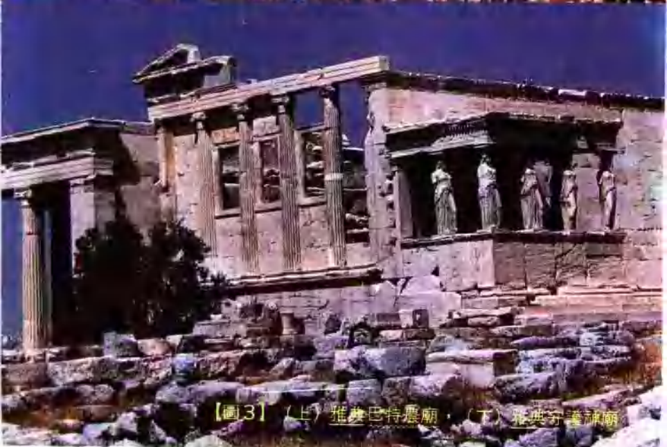
【圖3】(上) 雅奧巴特農廟，(下) 雅典守護神廟