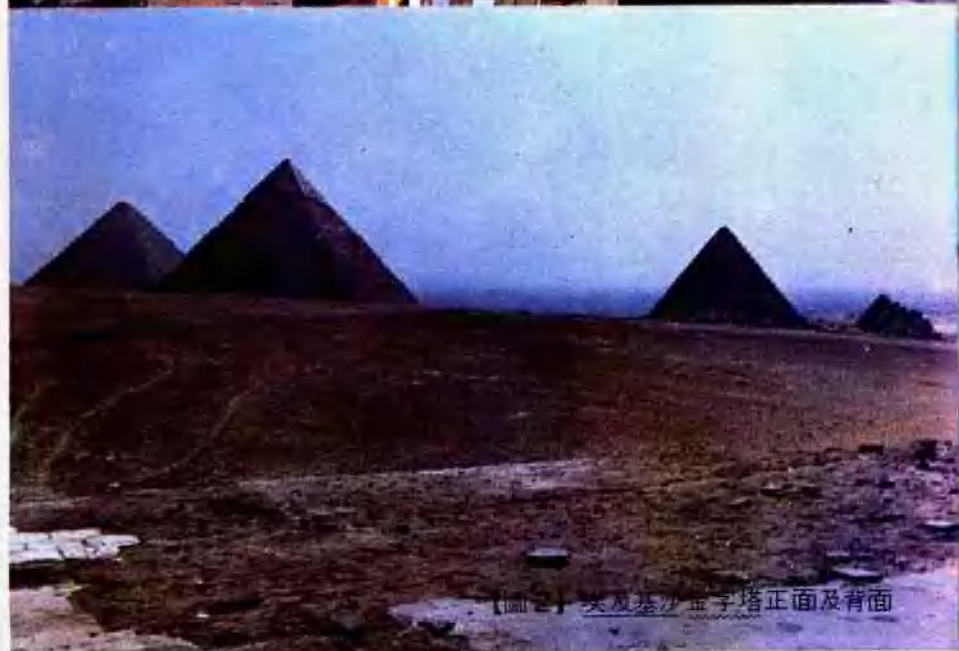
【圖2】埃及基沙金字塔正面及背面