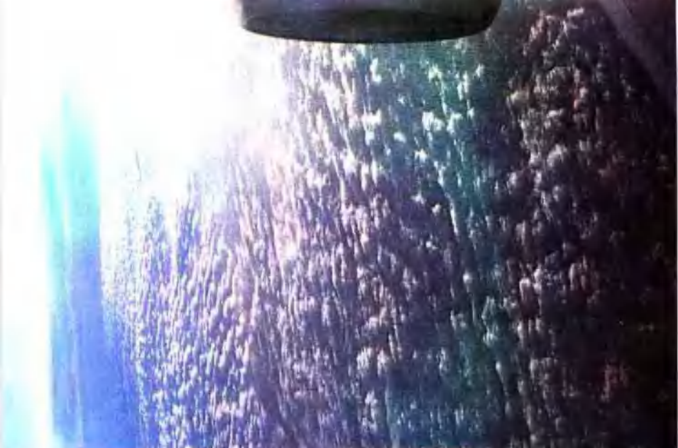
【圖1】(左)歐洲上空日出・(右)歐洲上空雲海