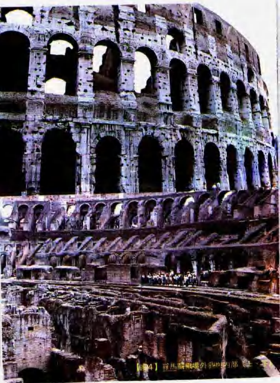
【圖4】羅馬鬥獸場外觀與內部（上）