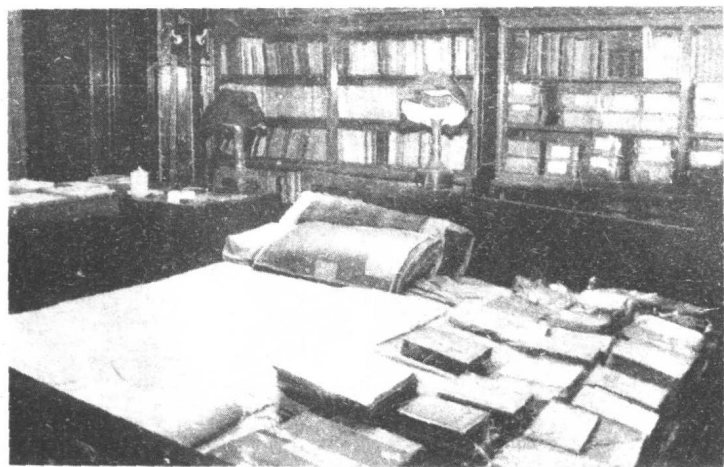
毛泽东在中南海的卧室