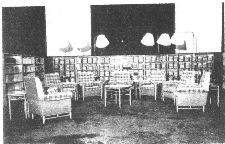
毛泽东在中南海的书房及会见厅