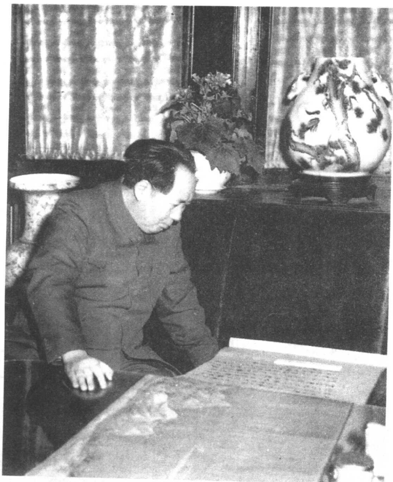
毛泽东在观赏中国古画(1953年)