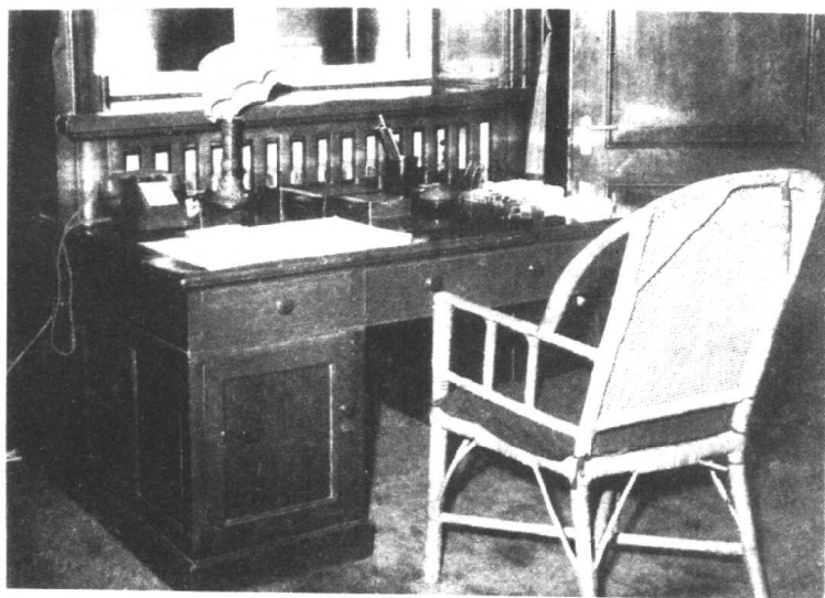
毛泽东在中南海的办公室