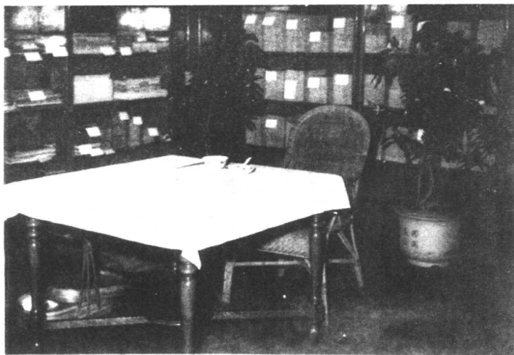
毛泽东在中南海的餐厅