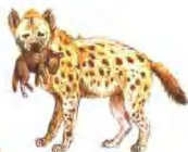
↑ 感到危险时，便将孩子叼住另寻巢穴。