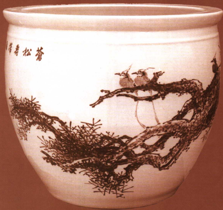
中国工艺美术大师王隆夫 青花斗彩苍松寿带图 2000 件世纪大龙缸