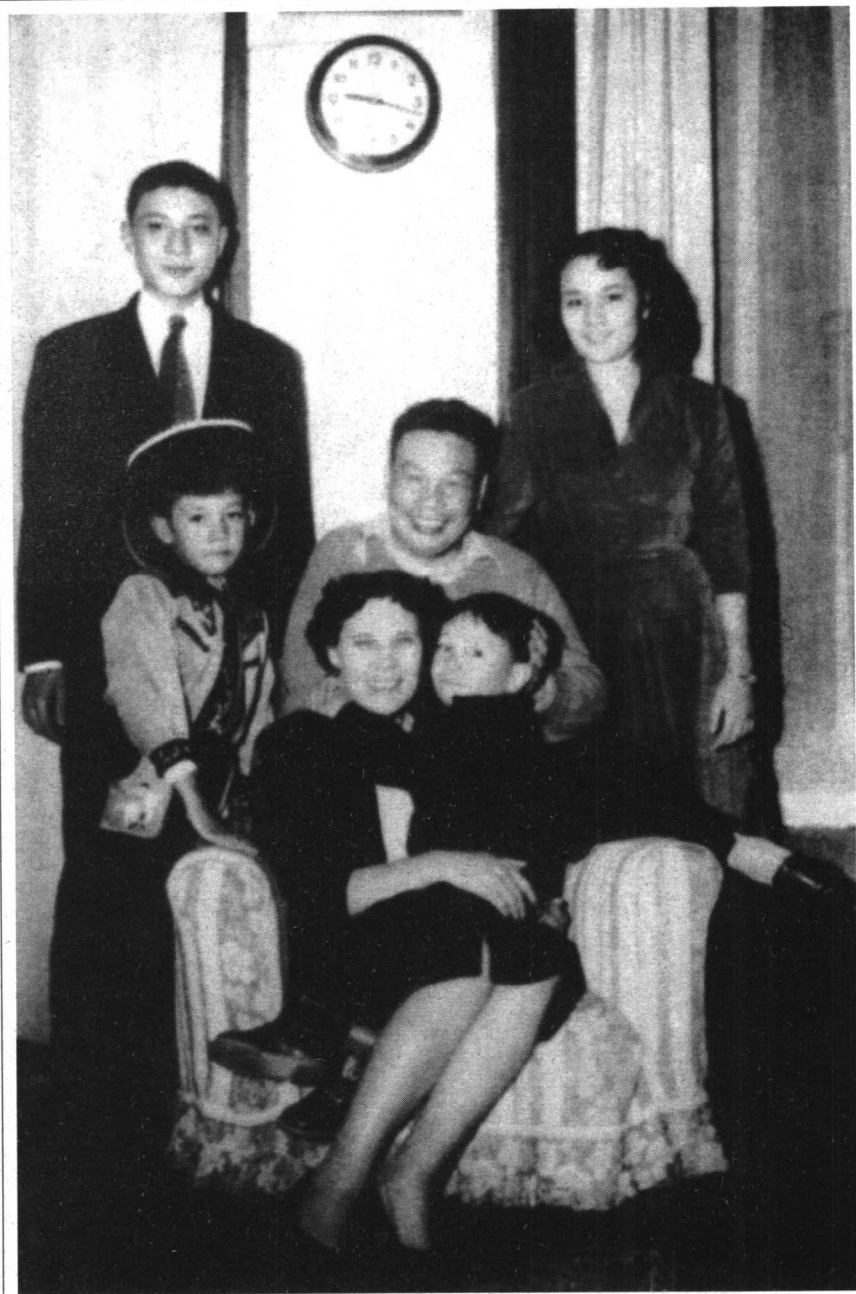
幸福时刻的美丽母亲。