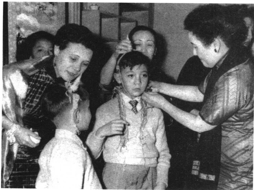
大家族中的洋媳妇——“贤良孝慈”。