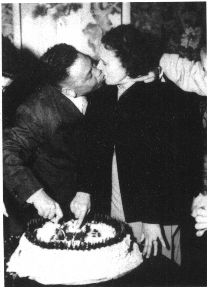
结婚 15 周年纪念日家庭聚会上的热吻。