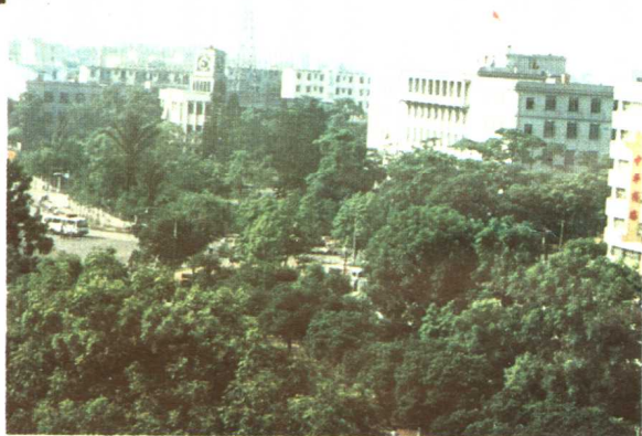
(下) 1987年国庆节天安门广场绿化人工造景