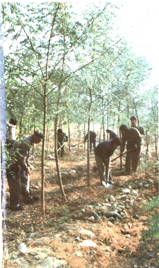
(上) 职工参加苗圃义务劳动