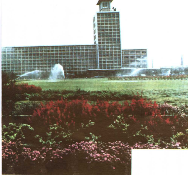
(上) 沈阳市政府大楼广场绿化