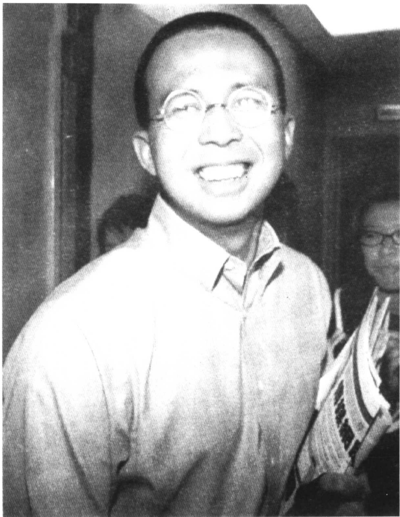
李泽楷说：“我要做亚洲第一！”