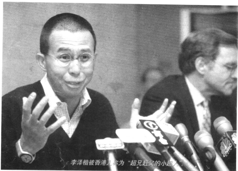
李泽楷被香港人称为“超兄赶父的小超人”。