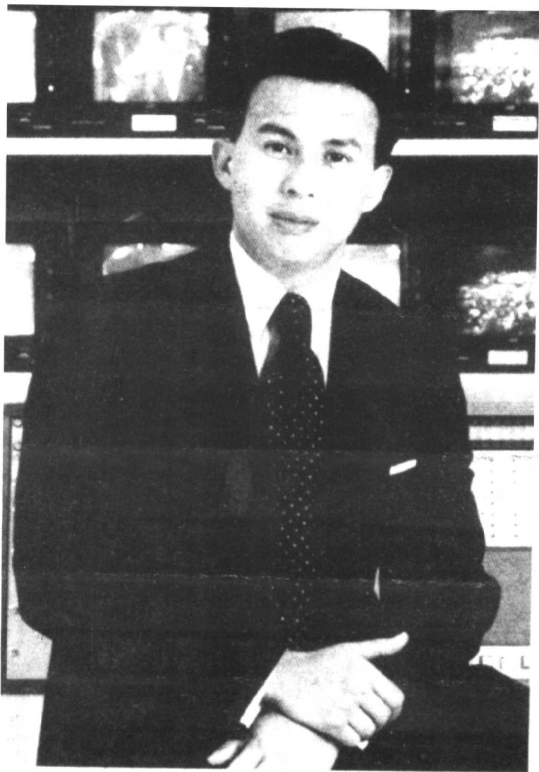
这是收购卫视时的李泽楷，虽然是初出茅庐，却神采飞扬，颇有“少年心事当拿云”的气概。