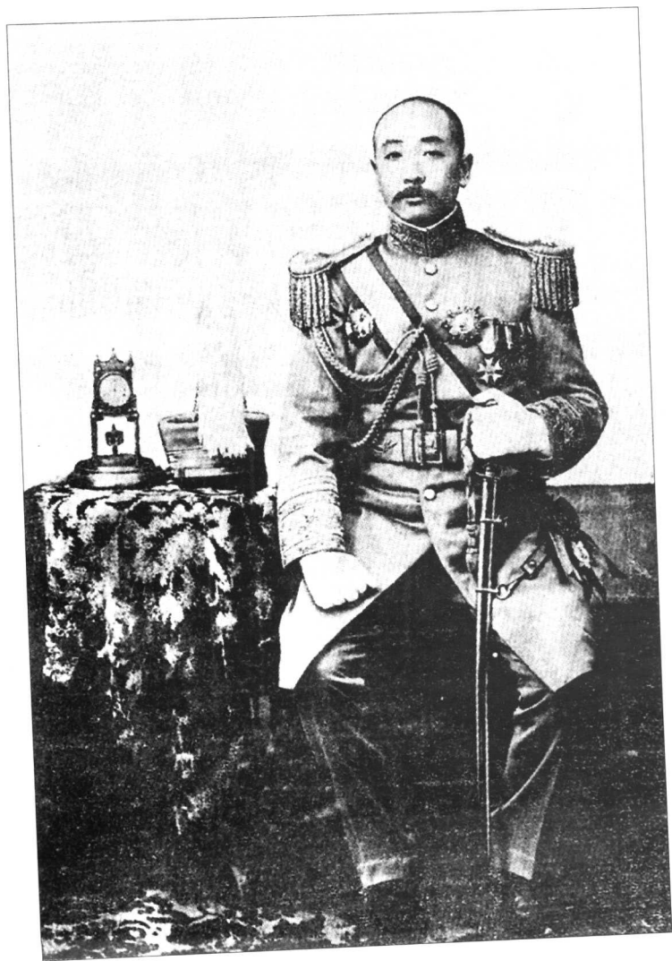
任东三省巡阅使时的张作霖