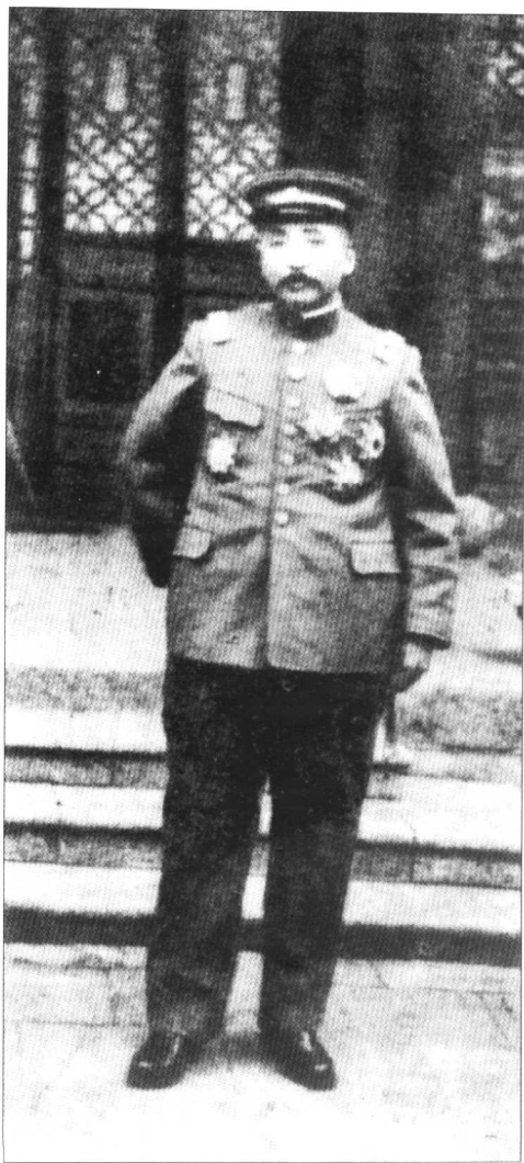
任安国军总司令时的张作霖