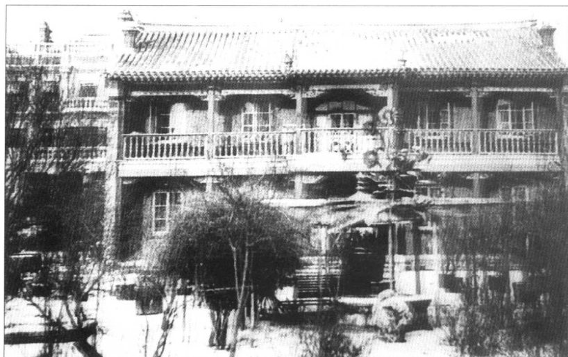
张氏帅府的大青楼