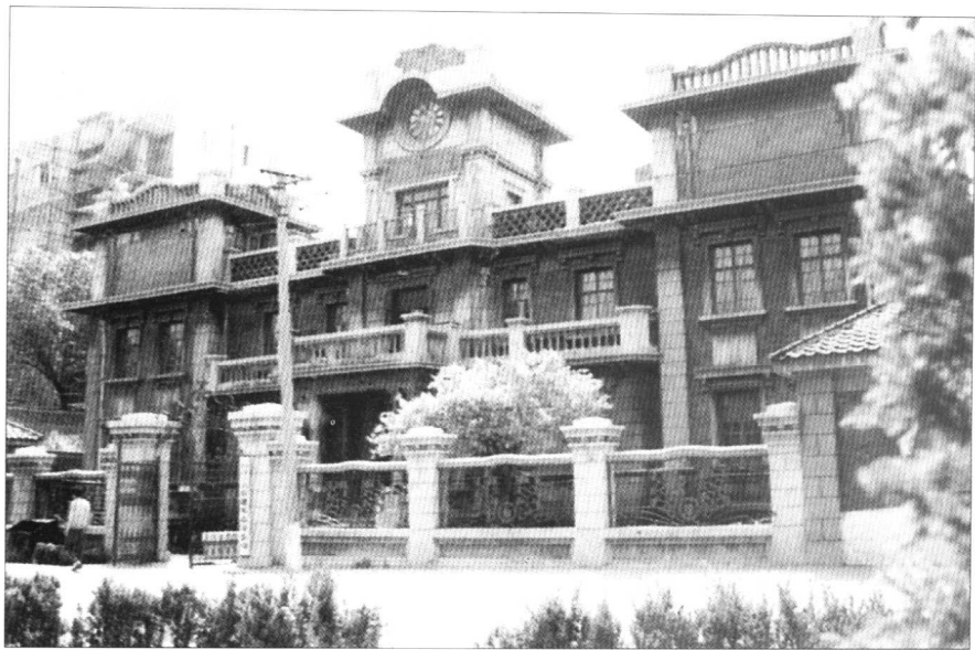
帅府办事处,又称帅府舞厅