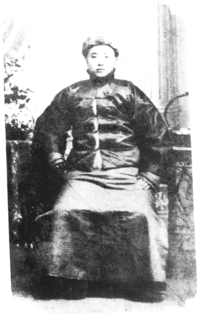
任清军巡防营统领时的张作霖