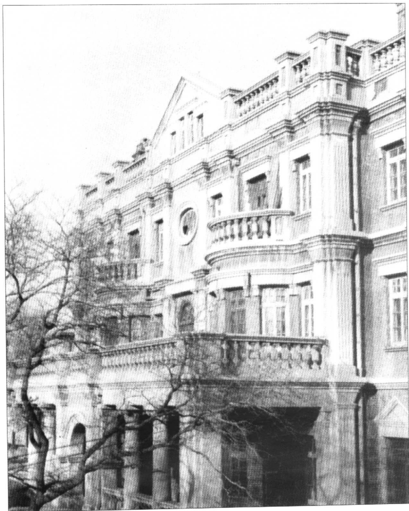
张氏帅府的小青楼