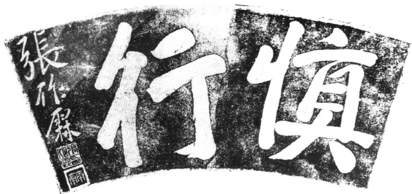
张作霖的墨迹“慎行”