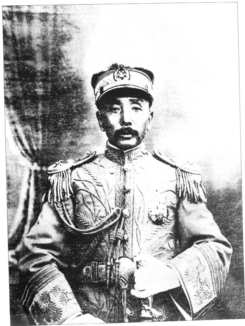
任中华民国陆海军大元帅时的张作霖