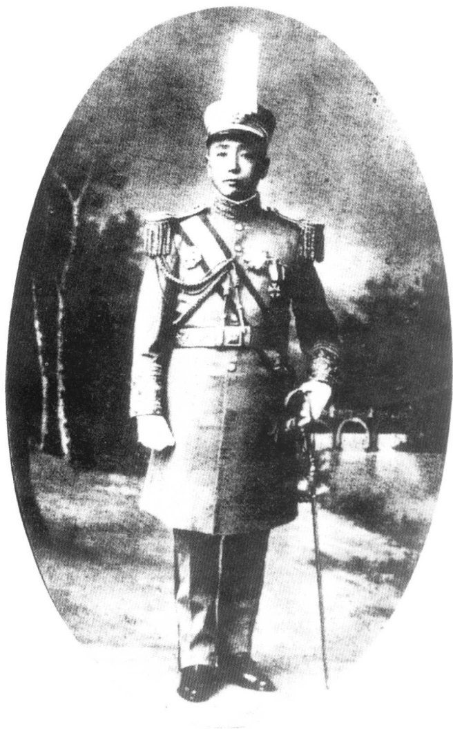
任民国陆军师长时的张作霖