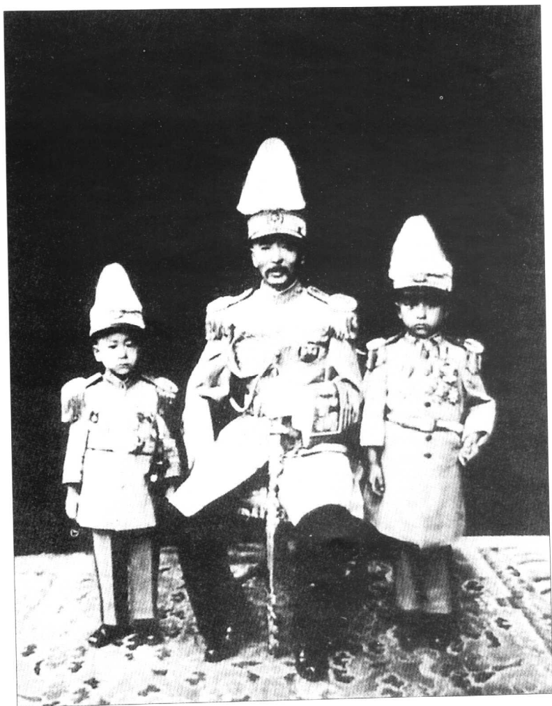
身着元帅服的张作霖与五子学森(左)、六子学浚(右)