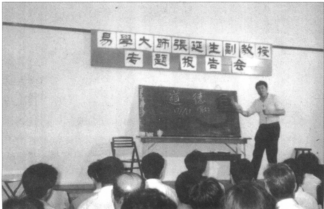
1992年6月南通易学报告会