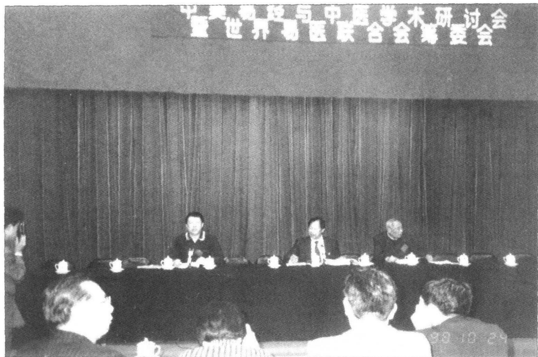
1998年10月北京中美易经与中医学术研讨会