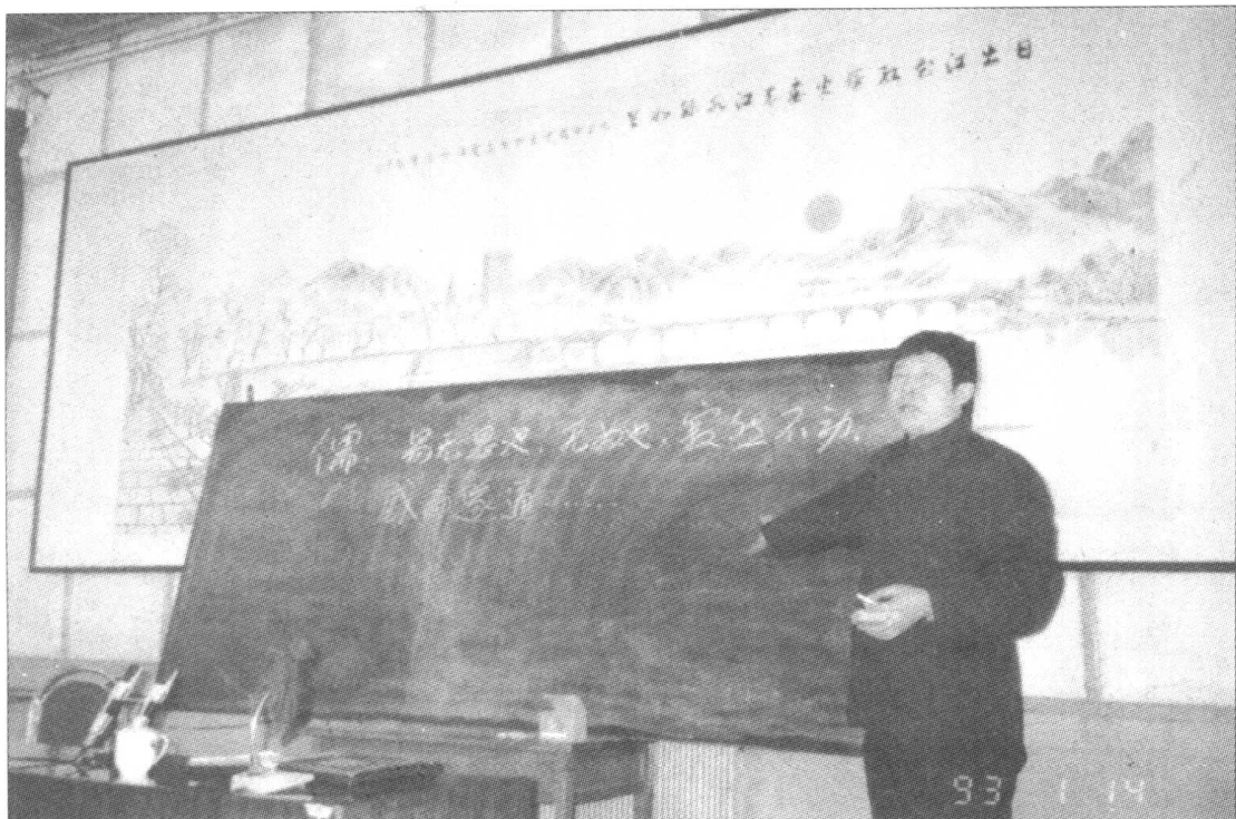
1993年1月在吉林市委举办讲座