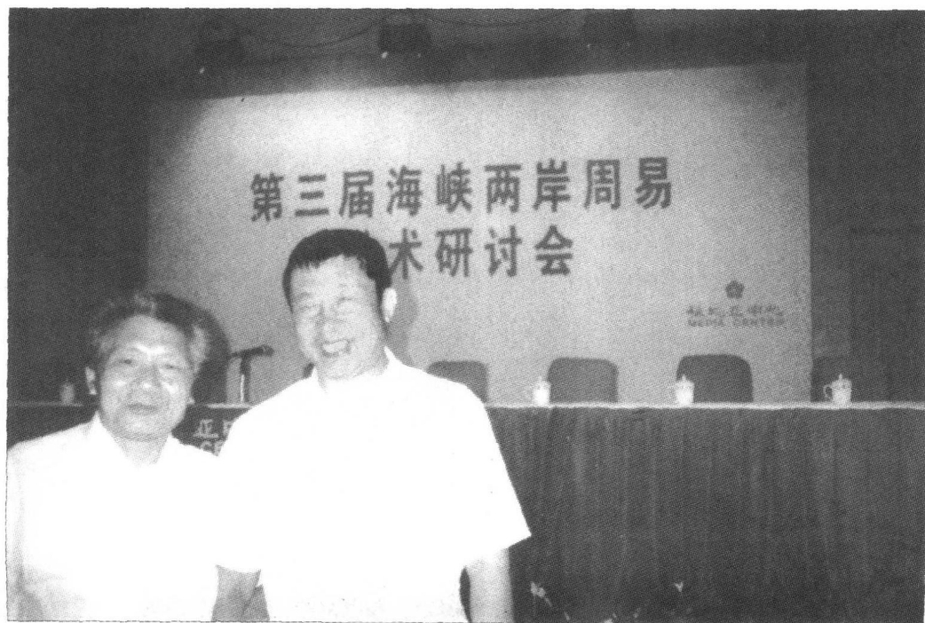
1997年8月北京三届海峡两岸周易学术研讨会