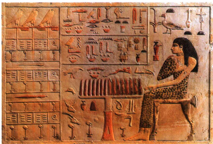
内非提亚贝石碑 石灰石着色 37.5cm × 52.5cm 第四王朝 约公元前2590年 吉萨公主墓出土

埃及艺术不论是建筑、雕刻、绘画，还是工艺美术，都是为法老和少数贵族服务的。由于法老和贵族有一定的要求，埃及的艺术作坊在艺术创作上都要严格服从顾主，这就使埃及艺术形成了许多程式，其中最著名的就是正面律。正面律表现在圆雕中即无论坐像、立像都是正面直对观众，头部、颈部和肩