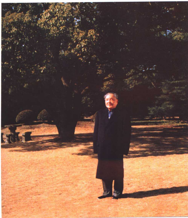
绿 树 常 青