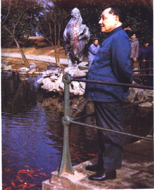
花 港 观 鱼