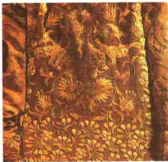
插圖11. 遼寧葉茂台遼墓繡帽局部