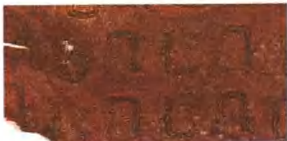
插圖 2. 河南信陽光山春秋早期黃國墓“竊曲紋”鎮繡殘片