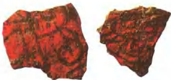
插圖 1. 陝西寶鵝茹家莊西周墓鎮繡織物印痕