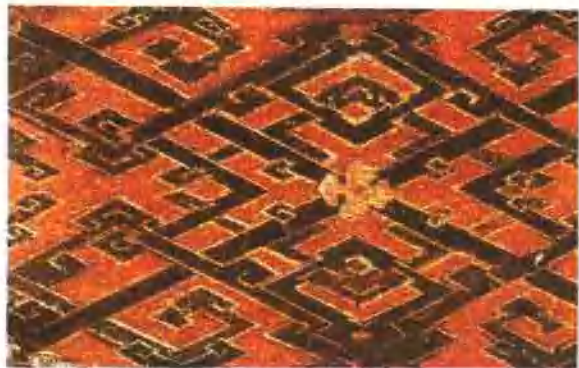
插圖 8. 湖南長沙馬王堆一號漢墓貼絹、貼羽毛錦紋樣