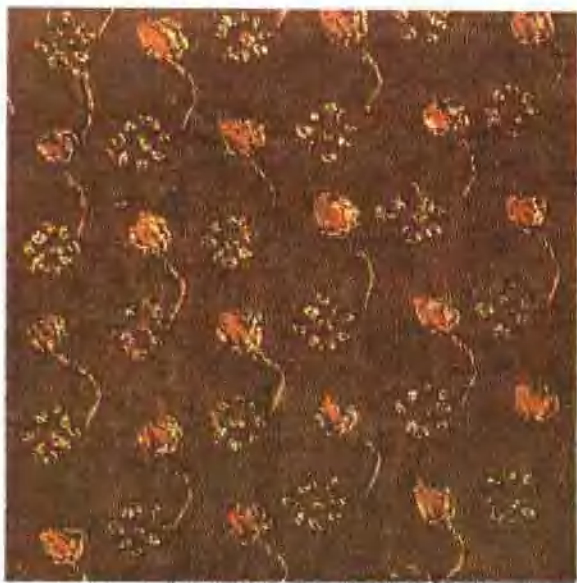
插圖 6. 湖北江陵鳳凰山西漢墓鎔繡小折枝花紋樣