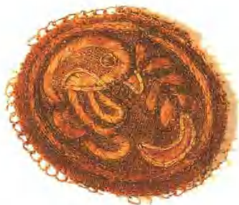
插圖10. 遼寧葉茂台遼墓繡香囊