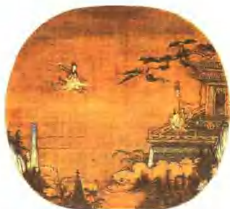
插圖12. 傳世南宋仿書繡《瑤台跨鶴圖》(遼寧省博物館藏)