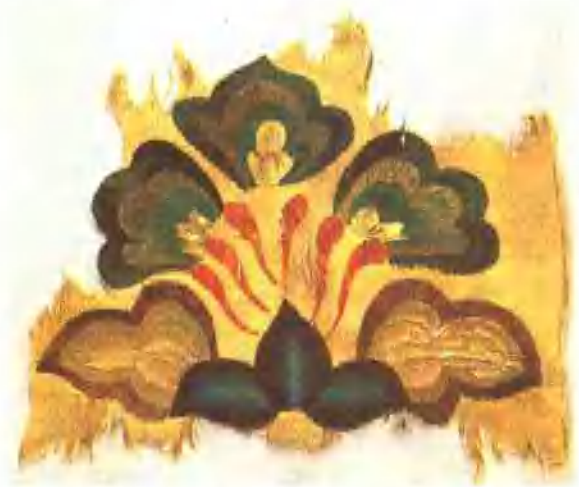
插圖 9. 新疆出土繡片摹本(王籽繪)