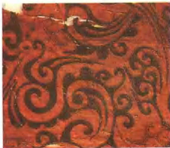
插圖 5. 湖南長沙馬王堆一號西漢墓“長壽繡”鎮繡紋樣