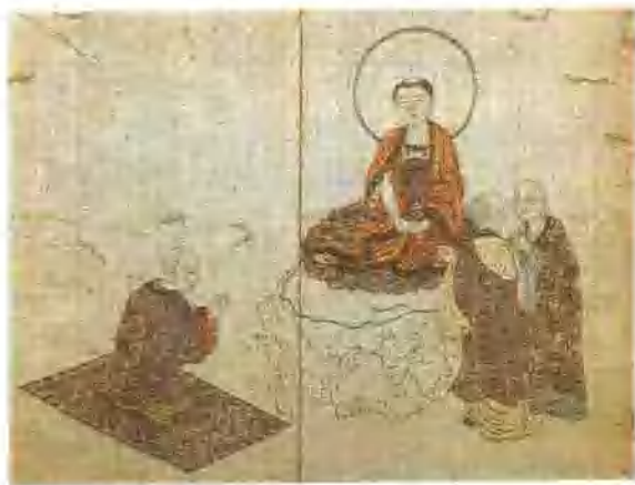
插圖13. 傳世元繡《金剛般若波羅蜜經冊》中之繡釋迦如來圖(遼寧省博物館藏)