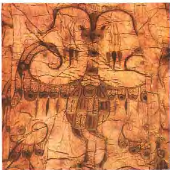
插圖 4. 湖北江陵馬王楚墓鎮繡鳥紋