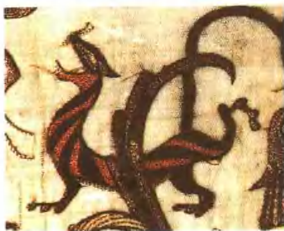
插圖 3. 湖北江陵馬王楚墓鎮繡虎紋