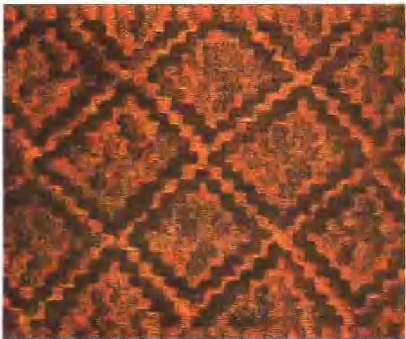
插圖 7. 湖南長沙馬王堆一號漢墓單套針平繡紋樣