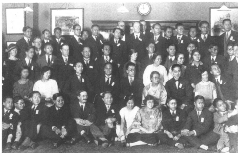
上:1924年9月,胡适(三排左二)与北大国学门同人(左起一排:董作宾、陈垣、朱希祖、蒋梦麟、黄文弼;二排:孙伏园、顾颉刚、马衡、沈兼士、胡鸣盛;三排:常××、徐炳昶、李玄伯、王光传、夏鼐)在三院译学馆原址合影。