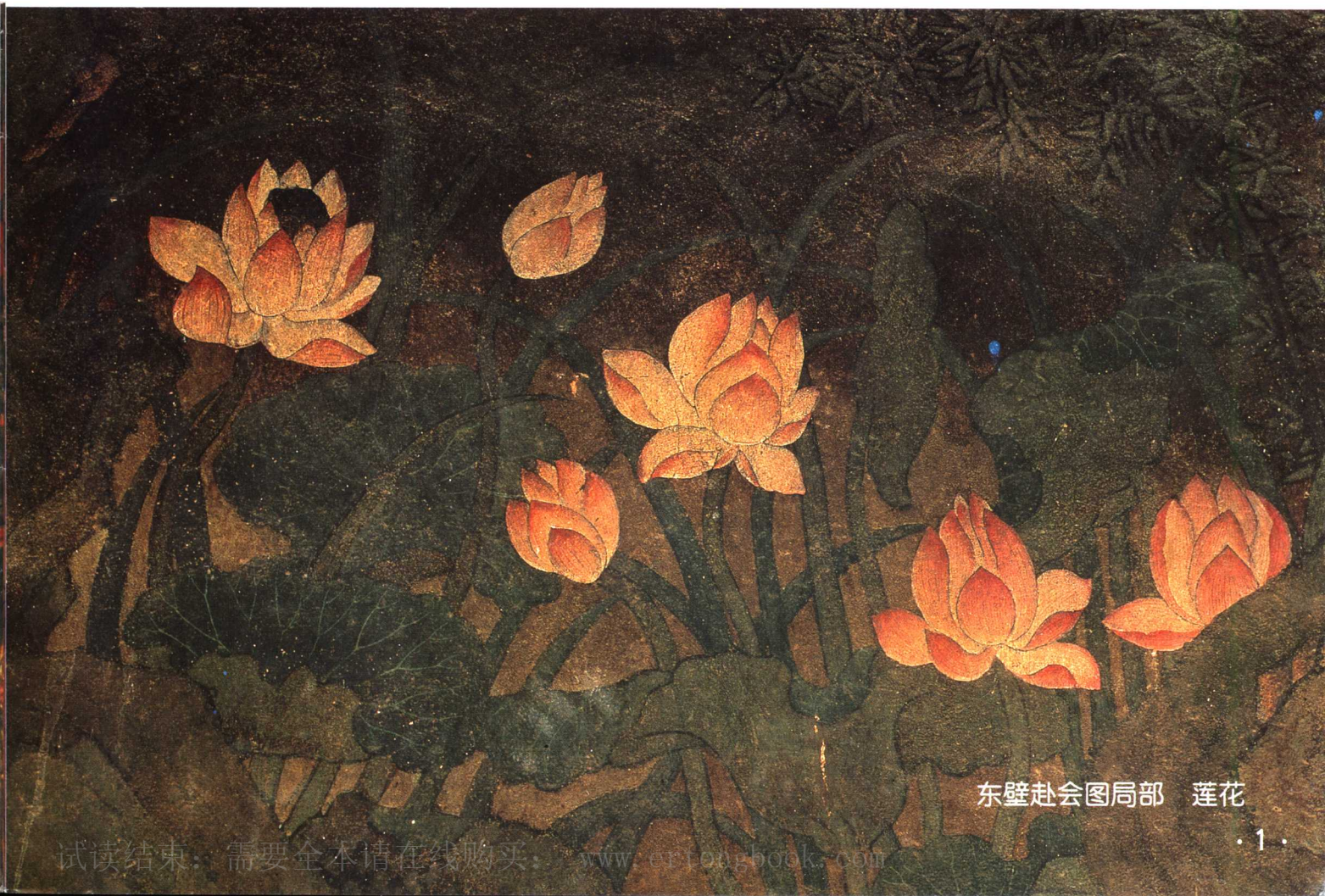
东壁赴会图局部 莲花