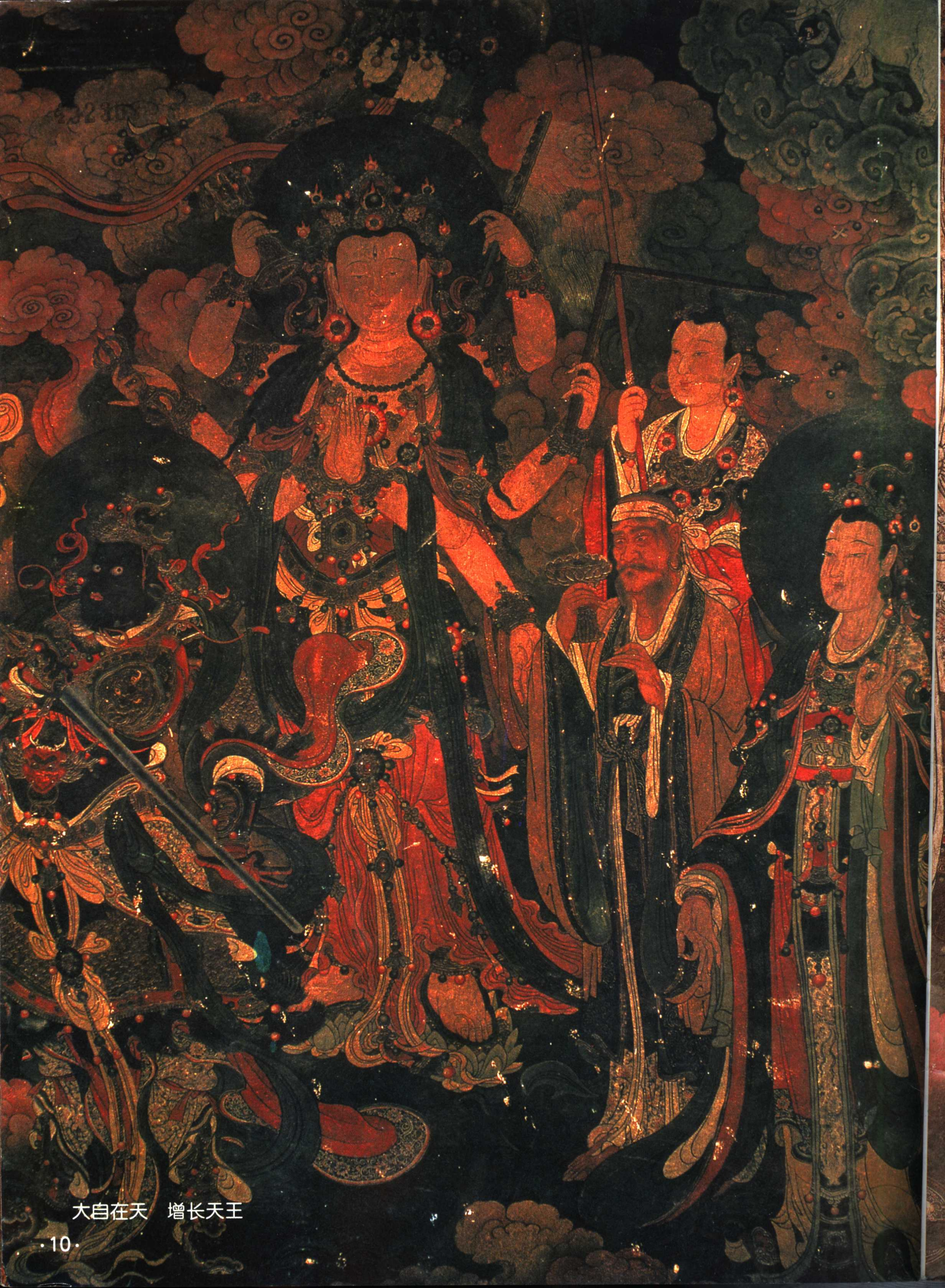
大自在天 增长天王