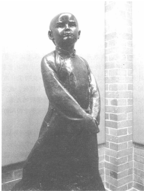
位于孙中山故居的少年孙中山塑像

并的野心。1865年，美国独立战争刚刚结束，其势力就侵入夏威夷。1874年，美国政府乘夏威夷统治集团内讧之机，派出海军陆战队在夏威夷登陆，支持架刺鸠取得王位，紧接着就胁迫架刺鸠签订所谓的“互惠条约”，从而控制了夏威夷的政治、经济、军事大权，夏威夷从此失去了独立的地位。夏威夷人民为了反对美国的侵略，喊出了“夏威夷是夏威夷人民的夏威夷”的口号，英勇抗击美国侵略者，拼死驱逐和打击入侵的敌人。当地的华侨也卷进了这场独立运动。