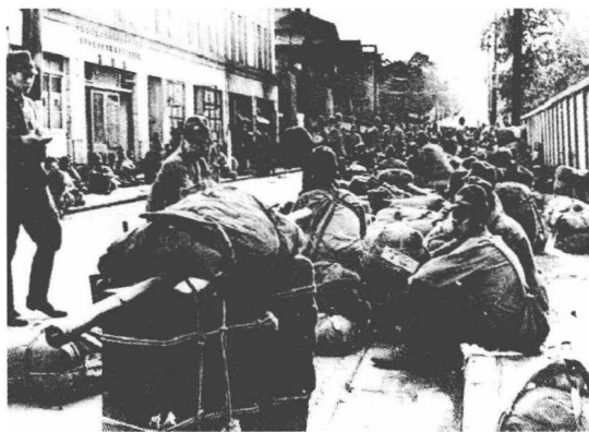
侵占了徐州的日军只想着该怎样摆“庆功宴”

虽然早已人去城空，但无论“华中派遣军”还是“华北方面军”，都没有在后面死死尾追，沿途也没有遇到太强的阻截，显然，这与日军上上下下的功利心态有关。这帮人的主要力量都没有拿来对付突围部队，他们满脑子转来转去的，还是如何在同仁面前争得头功，以及怎样在徐州大摆“庆功宴”。