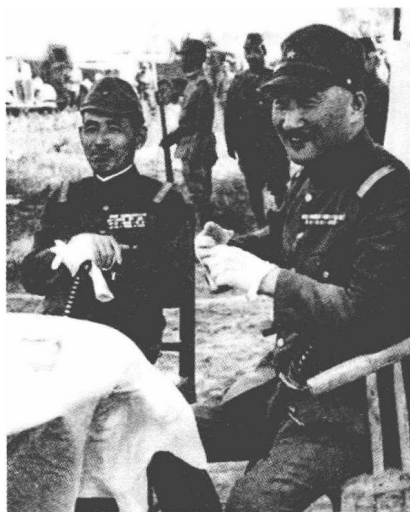
畑俊六（左一）因受枪伤而干瘦如柴