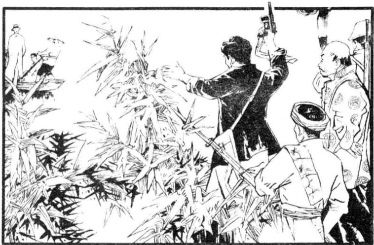
3. 这一伙人用枪逼着船老板停船靠岸。