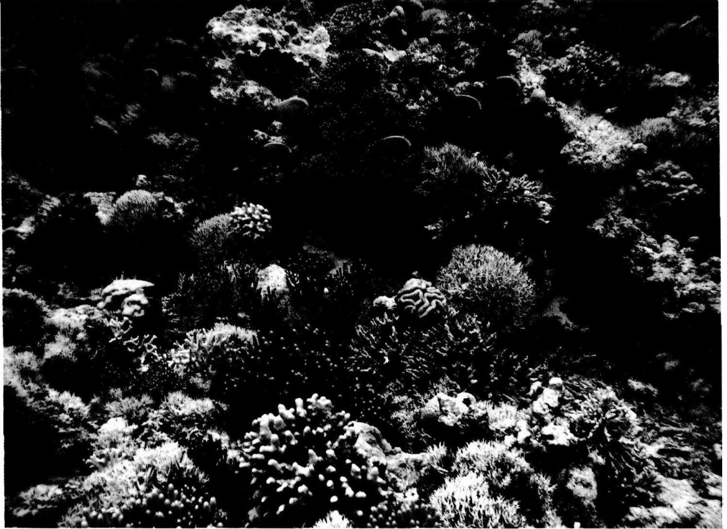
五彩缤纷的海底世界