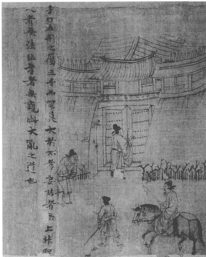
李公麟《孝经图》（局部）