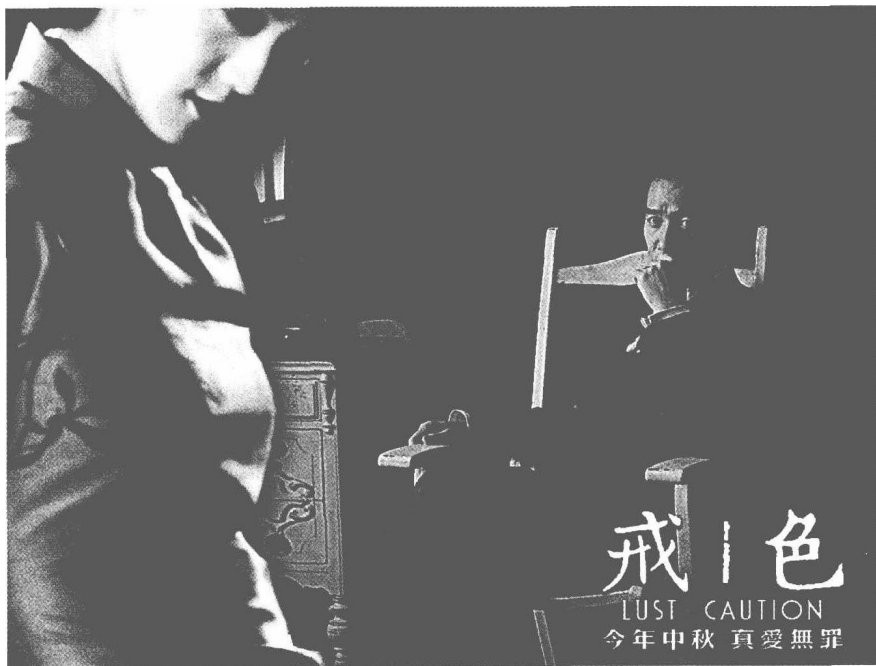
图 1-2 影片《色·戒》引发社会关注

在电影领域，近几年来关于建立电影分级制度的呼吁一直没有停止。早在2003年，政协委员、著名编剧王兴东就已经在“两会”期间提出关于设立电影分级制度的议案。近几年来，《满城尽带黄金甲》、《夜宴》、《门徒》、《让子弹飞》等影片中涉及裸露、暴力、毒品的内容继续屡屡引发争议。2007年，相关事件不断：大批国人专程到香港甚至美国观看完整版《色·戒》，有观众以“公民”身份将影院和行业管理部门告上法庭，广电总局对影片《苹果》的“违规行为”进行追加处罚……2008年“两会”期间，尹力、冯小刚等导演再次呼唤电影分级，广电总局重新强调电影审查标准，关于《色·戒》女演员“被封杀”的种种传闻与报道引发国内热议甚至国际瞩目。