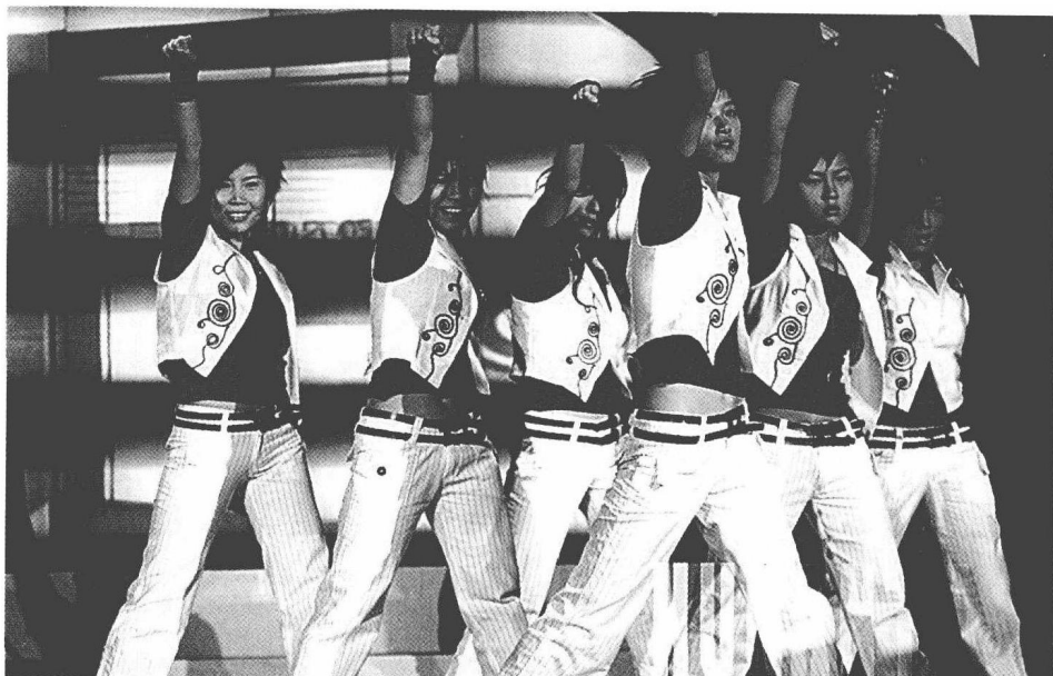
图 1-1 引发全民娱乐潮的《超级女声》

不断加强：从黄金时段禁播“涉案剧”，到整治婚外恋题材；从要求黄金时段必须播“主旋律”影视，到要求全面抵制低俗之风；从对电视台、电台违规广告的治理，到对个别选秀节目的紧急叫停以及对选秀节目的全面整顿……可以说，从力度与频率看，国家广电总局的监管已经达到了前所未有的程度。在主导文化的强力干预与监管下，娱乐文化急剧扩张的势头受到了暂时的抑制。