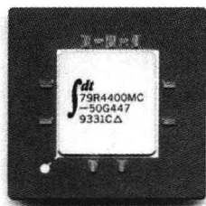
图 1.2 存放机器语言指令的 CPU 芯片

机器语言是直接用二进制代码指令表达的计算机语言，指令是用 0 和 1 组成的一串代码，它们有一定的位数，并分成若干段，各段的编码表示不同的含义。例如，某台计算机字长为 16 位，即由 16 个二进制数组成一条指令或其他信息。16 个 0 和 1 可组成各种排列组合，通过线路变成电信号，让计算机执行各种不同的操作。如某种计算机的指令为 1011011000000000，它表示让计算机进行一次加法操作；而指令 1011010100000000 则表示进行一次减法操作。它们的前 8 位表示操作码，而后 8 位表示地址码。从上面两条指令可以看出，它们只是在操作码中从左边第 0 位算起的第 6 和第 7 位不同。这种机型可包含 256 ( 2^8 ) 个不同的指令。如图 1.2 所示为一种存放机器语言指令的 CPU 芯片。