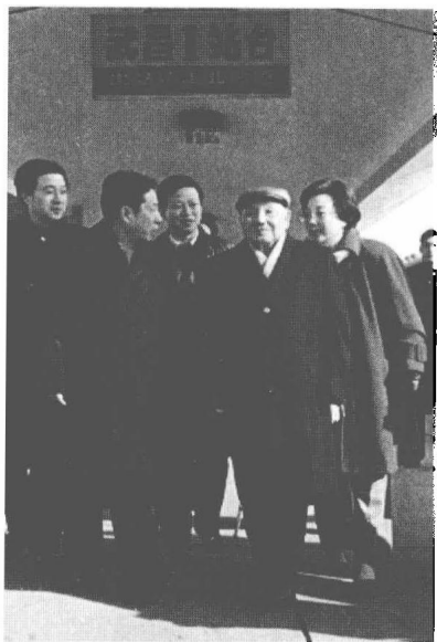
邓小平南方视察经武昌站