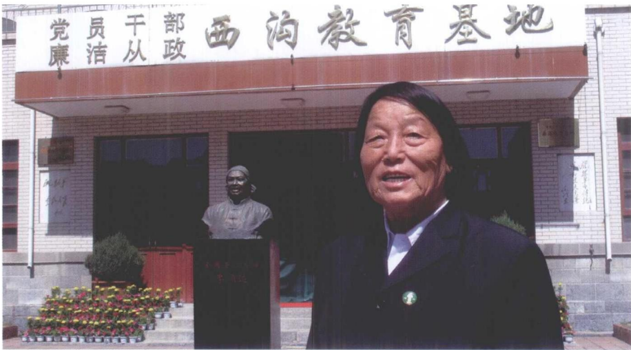
申纪兰在西沟教育基地。