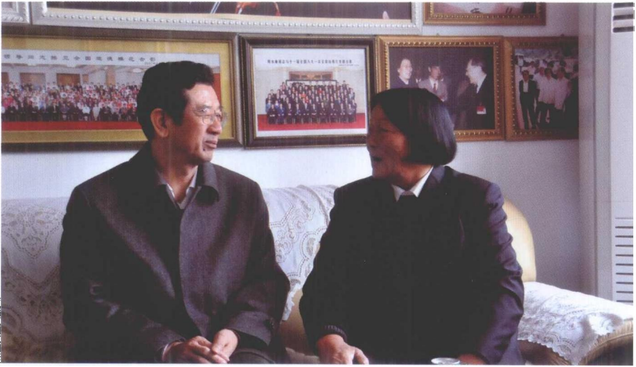
2010年2月6日，山西省长治市委书记田喜荣到西沟调研。