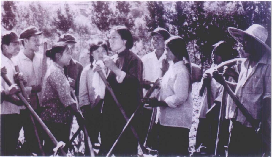
申纪兰带领村民参加劳动。