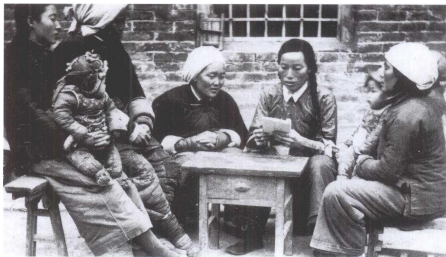
申纪兰（右二）发动妇女参加劳动。