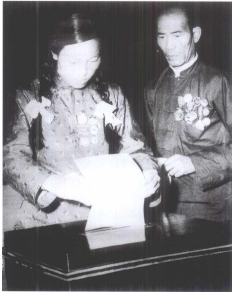
1954年6月，申纪兰在第一届全国人大一次 会议上投票。