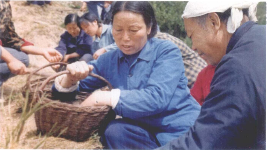
李顺达和申纪兰带领村民在山上栽油松。