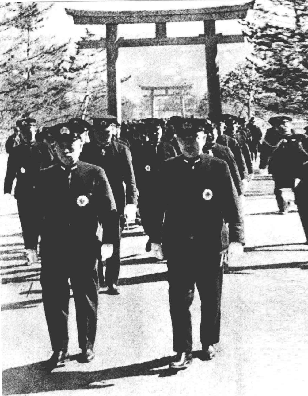
▲ 1940年2月20日参拜檀原神社(右边是山本五十六后继任联合舰队司令长官的古贺峰一大将)。