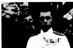
第二次世界大战十大名将丛书