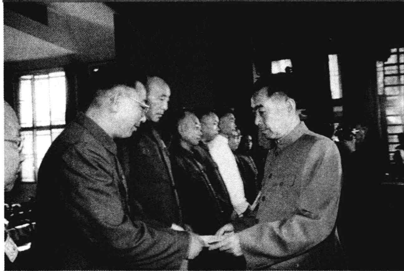
周恩来总理向粟裕颁发命令状。