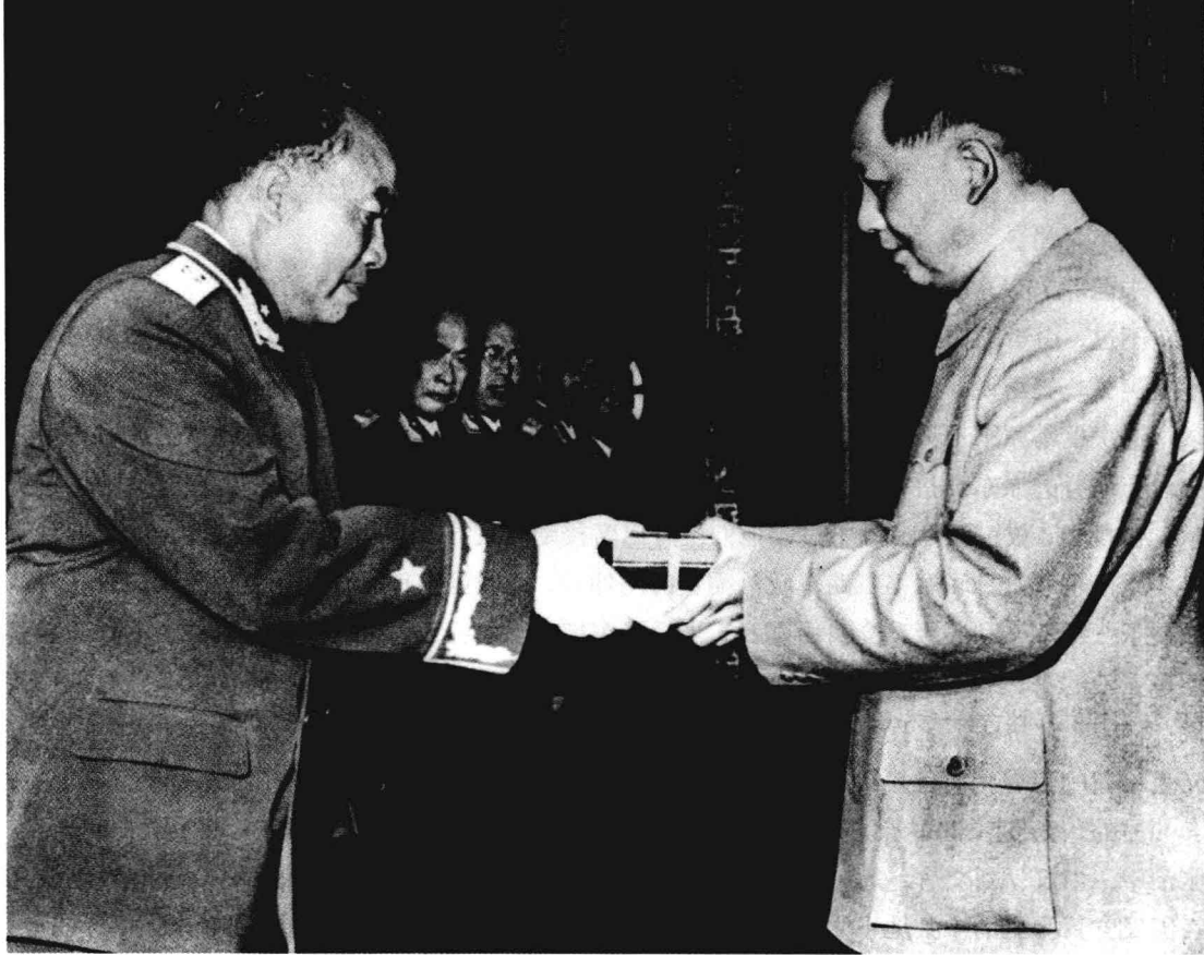
毛泽东向朱德元帅颁授勋章。