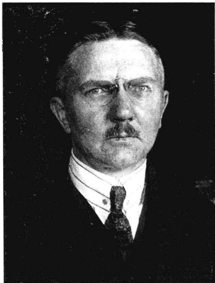
德国帝国中央银行行长 雅尔马·沙赫特(Hjalmar Schacht)

月26日，甚至跌到了1美元兑11万亿马克。但就像拉伸过头的橡皮筋，市场奇迹般地出现了马克反弹。到12月10日，美元兑马克终于稳定在1美元：4.2万亿马克的平衡点上。事实证明沙赫特的判断是准确的，而且时机拿捏得相当到位。市场开始惊呼，沙赫特是经济奇人！同时，德国政府用尽全力，终于在1924年1月实现了预算平衡。