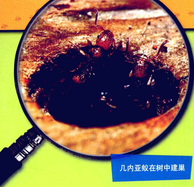
几内亚蚁在树中建巢