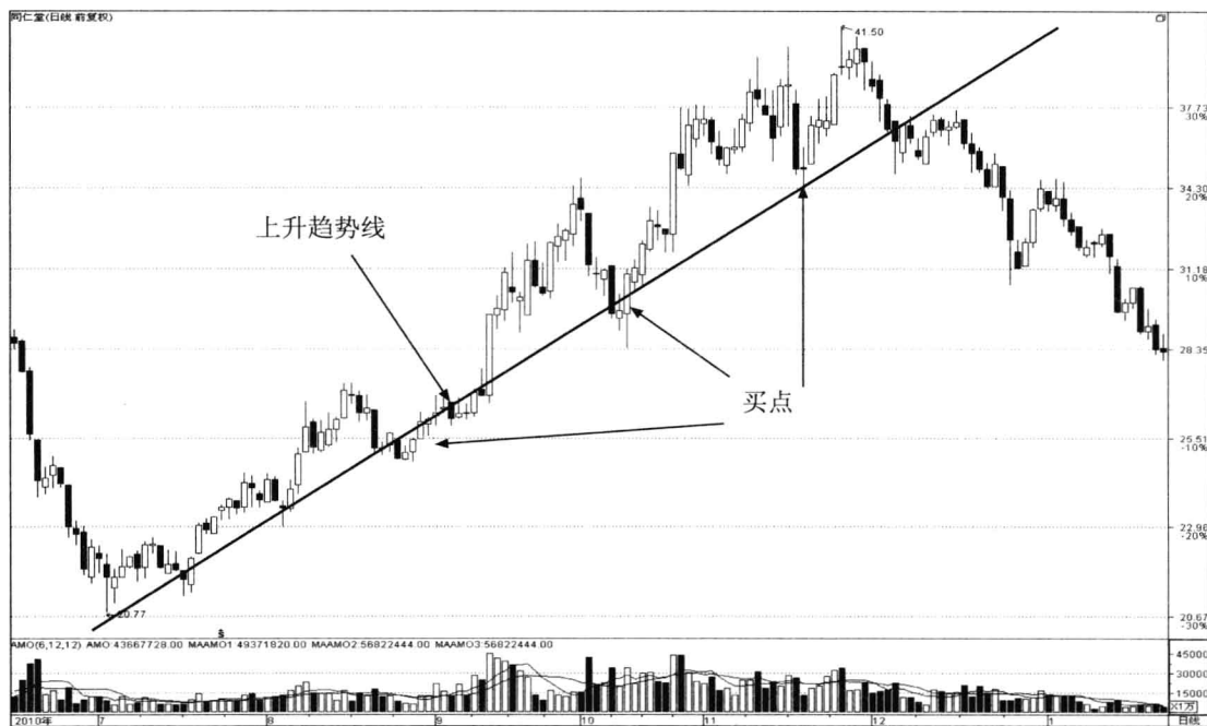
图 1-1 同仁堂（600085）上升趋势线

上升趋势线又称为支撑线，不仅能指出股价运行的趋势，而且对股价具有支撑作用。股价每次回试上升趋势线不破都是很好的买点。根据几何学里画线原理，两点确定一条直线，所选的两点之间的时间越长，上升趋势线的支撑作用就越牢固；股价回试上升趋势线的次数越多，也就是说上升趋势线上的回试点数越多，趋势线的支撑作用就越牢固（图 1-1 所示）。