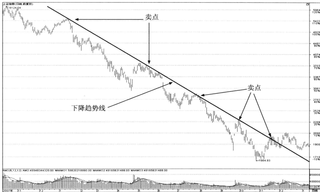
图 1-2 上证指数 (999999) 下降趋势线

如图 1-2 所示，2008 年 1 月 5 日和 2008 年 5 月 15 日出现了两个明显的转折点，以这两个明显的转折点为基点画出一条直线，这条直线就是下降趋势线。上证指数在 6 月 2 日、7 月 28 日、9 月 25 日和 11 月 19 日又分别回试了此趋势线，在下降趋势线的压力作用下，指数遇到压力反弹结束，又开始下跌。