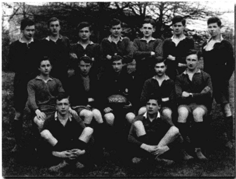
▲学生时代的奥克肖特(1913—1918,图中间拿着橄榄球者)

* 图片来源: http://www.michael-oakeshott-association.com/index.php/about-oakeshott