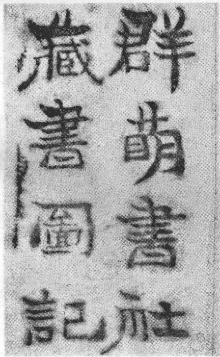
瀏陽群萌學會藏書處，稱群萌書社，圖記印文出自唐才常手筆